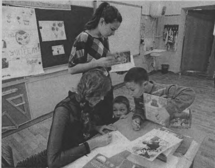
◆ Какие ошибки увидел юный учитель?

За этой, казалось бы, игрой стоит необычайно эффективный воспитательный момент. День-перевертыш очень сильно способствует демократическому и гуманистическому воспитанию школьников. Дети имеют уникальную возмож-