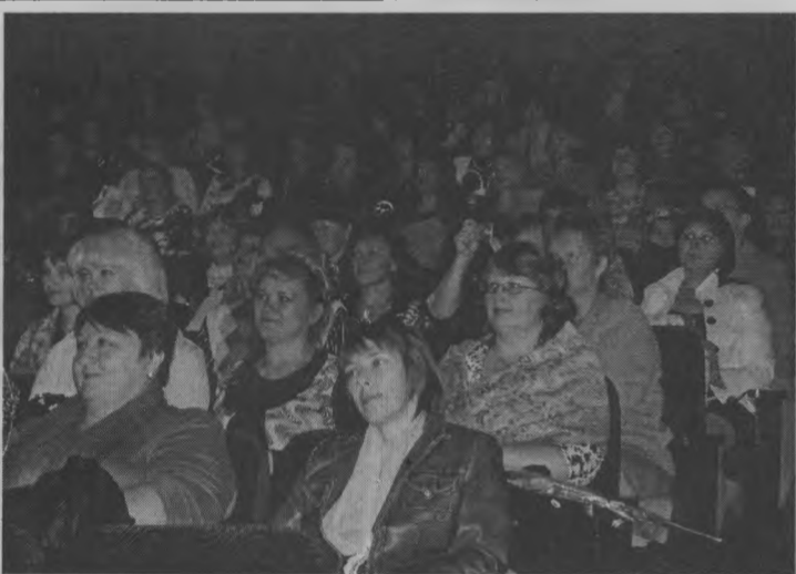
◆ Пусть всегда на лицах педагогов сияют улыбки!

Для всех награжденных в этом конкурсе были приготовлены дипломы и сертификаты главы Тоншаевской районной администрации.