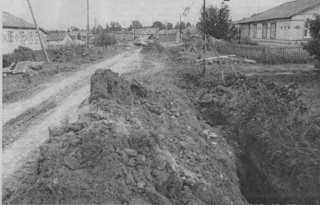
В момент строительства.

Самое первое общее собрание граждан по реализации проекта по поддержке местных инициатив в нашем районе состоялось еще в апреле в Березятской администрации.