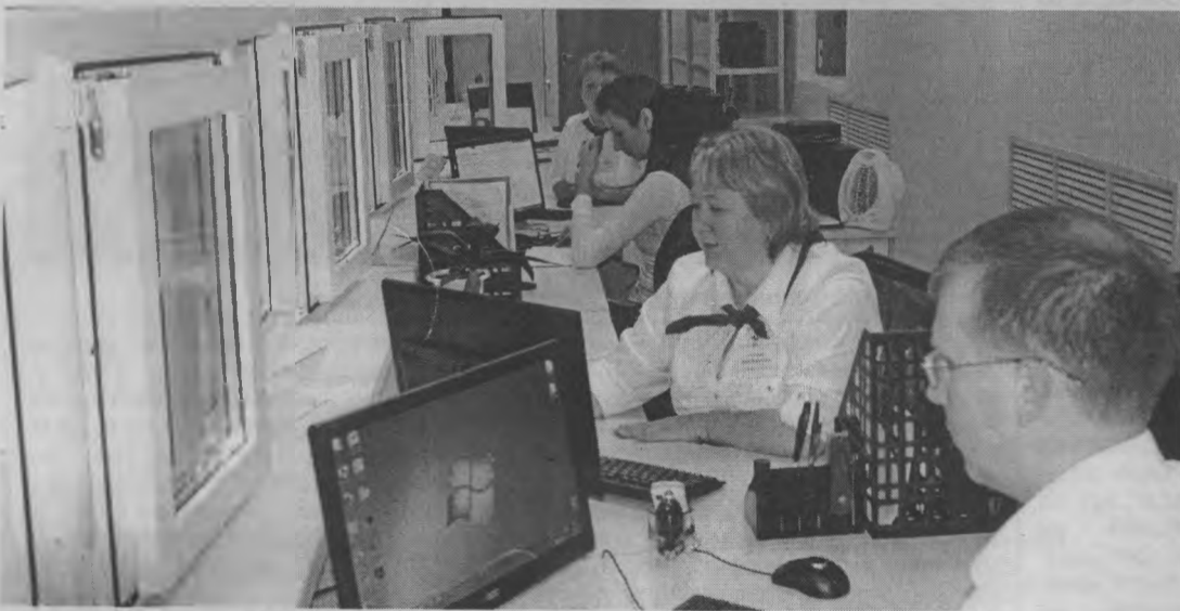
◆ Специалисты МФЦ готовы к работе.

Давайте уточним: какие услуги может оказать МФЦ уже сегодня? И какова их цена?