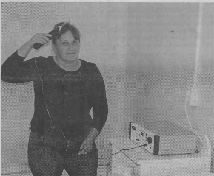
◆ "Очень нужный аппарат!"

пол, застелили его специальным антистатическим линолеумом, выровняли стены и потолки, которые сделали ниже, расширили проемы. Сменили все старые деревянные окна на пластиковые, повесили жалюзи. Уже сейчас чувствуется,