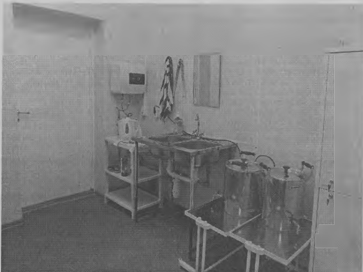
◆ Все новенькое: и раковины, и водонагреватель, и шкаф...

что стало намного теплее. Ветер и холодный воздух не проникают в помещения. Установили, где было нужно, новые пластиковые двери. Закрыли решетки батареи отопления. Кстати, это одно из основных требований к физиокабинету. Стены покрашены огнеупорной краской. Она у нас нежного, светло-салатового пастельного тона, матовая. В кабинете физиотерапии ничего не долж-