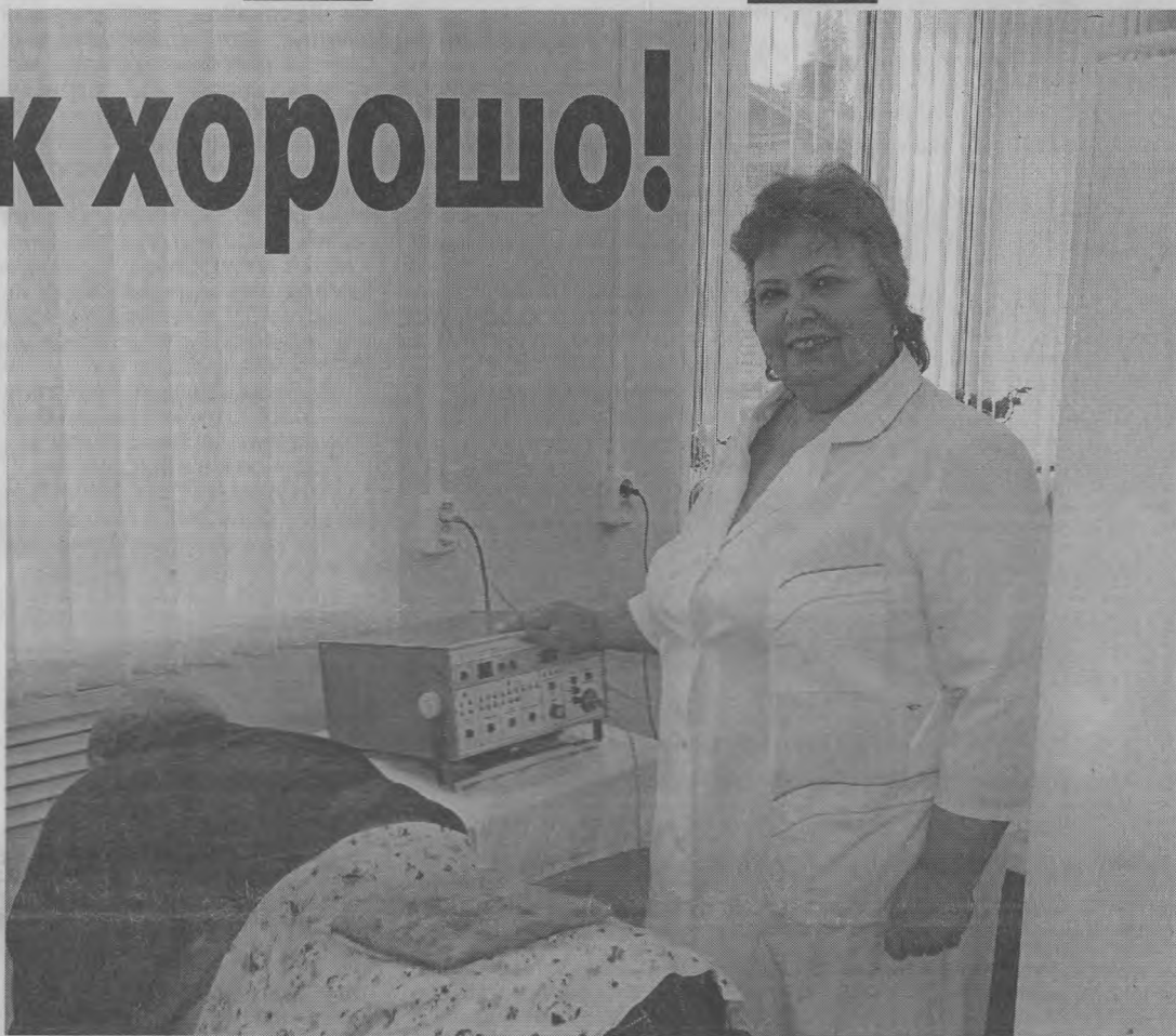
◆ "Работать в таком красивом и современном кабинете - одно удовольствие!"

но раздражать. Чтобы лечение больных проходило эффективно, нужно, чтобы они могли у нас успокоиться, расслабиться, отдохнуть.