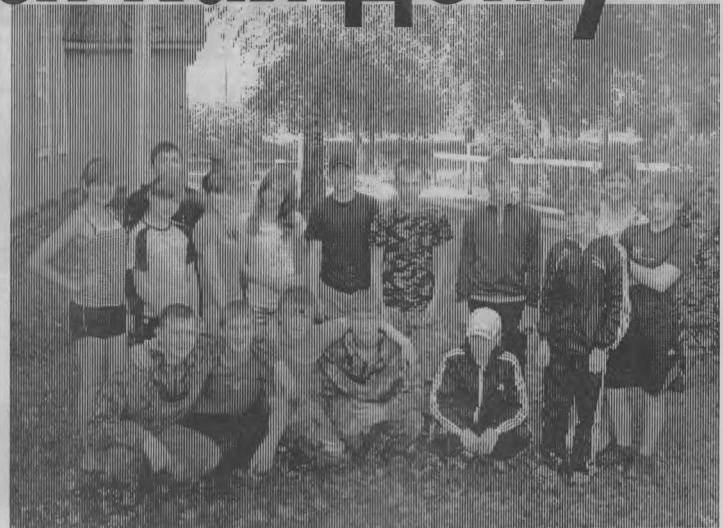
◆ Бригада «Планета ММ».

По результатам всех представленных материалов конкурсная комиссия присудила