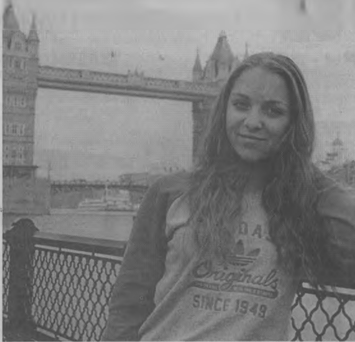
◆ В туманном Лондоне.

- Нет, это была своеобразная практика. По 3 часа в день мы учились. Кроме нас туда приехали учащиеся и студенты из других стран. Мы общались с ними на английском, тем самым повышали свой уровень знаний языка. В первый день было сложно привыкнуть к тому, что все вокруг говорят только на английском. В свободное время мы гуляли, ходили по магазинам, изучали достопримечательности. Жители Великобритании очень дружелюбные и приветливые. На улицах никто никому не хамит, как это часто бывает в России. Если кто-то тебя случайно толкнет, то обязательно извинится, даже если ты сам не прав. Как-то раз мы с