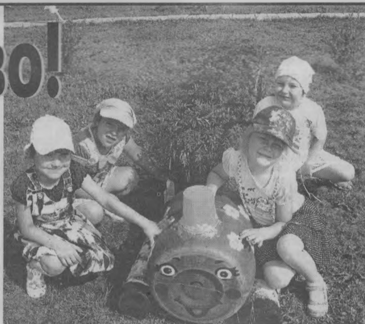
◆ Паровозик из «Ромашки».

С особым интересом родители и сотрудники нашего детского сада оформляли альпийскую горку. Альпийская горка - яркая декоративная изюминка, способная преобразить любой участок. Родители завезли материал для нее и вместе с педагогами создали шедевр. Компонировать растения старались таким образом, чтобы альпий-