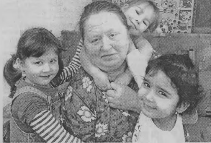
◆ «Любимая наша!»