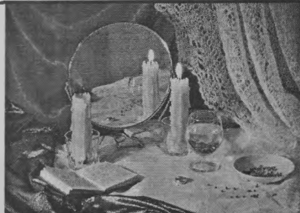
судьба, а может, и волшебное гадание свело их!

С тех пор они не расстаются уже 30 долгих, счастливых лет. Они нашли друг друга, как солнце небо, как капля океан. Может, это и совпадение, может,