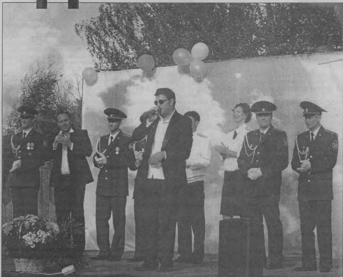
◆ Звучали лирические песни.