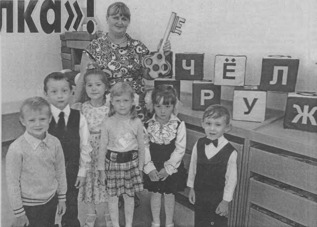
◆ Ключ в руках - можно приступать к работе.

«Пчелка» - третий семейный детсад, появившийся за прошлый и нынешний годы в нашем районе, в п. Тоншаево. Он так же, как и предыдущие, открылся благодаря реализации программы «Создание семей-