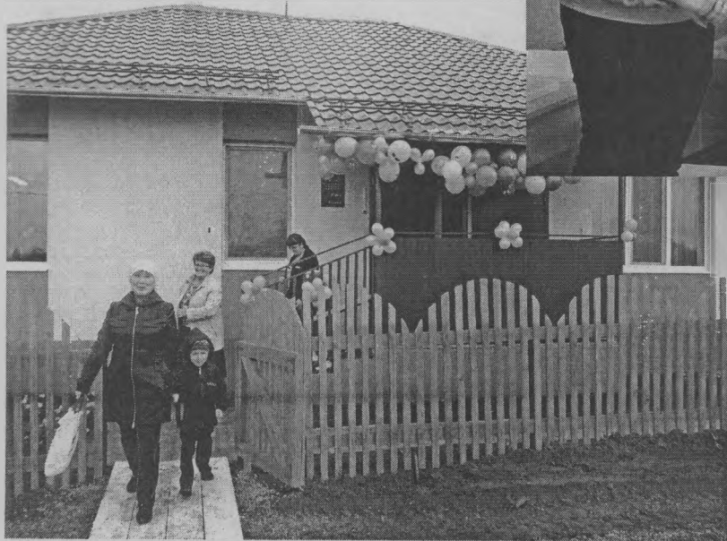
◆ Дорога в «Пчелку» проторена!