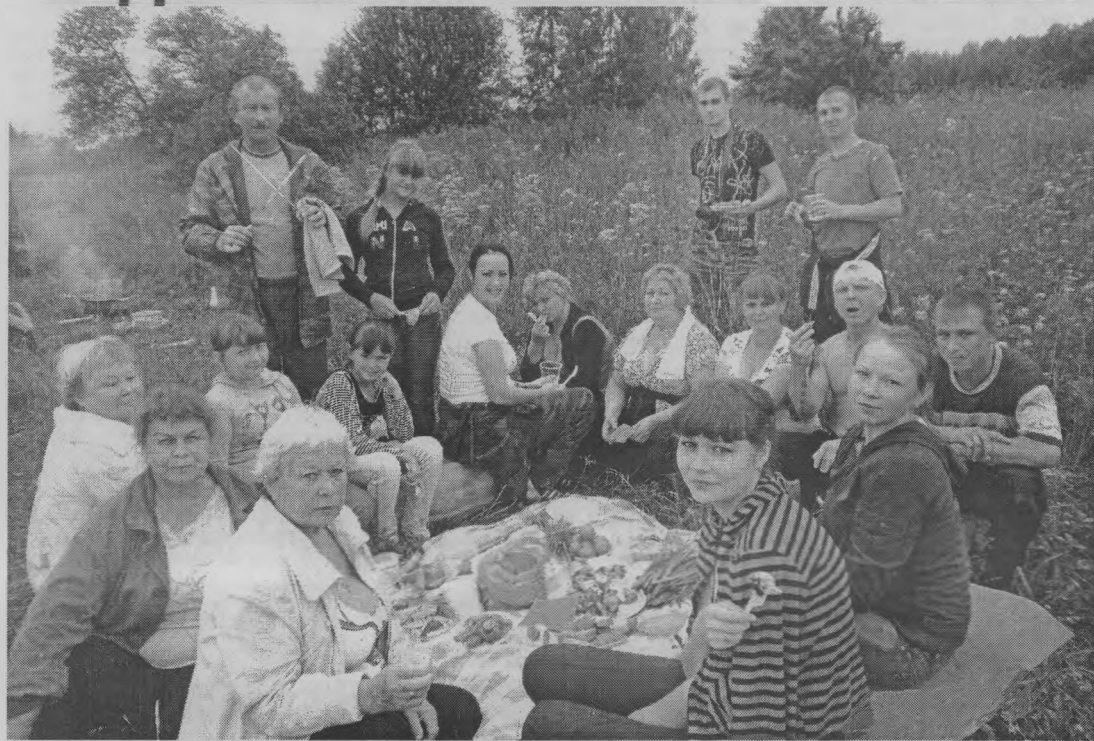
◆ «Наша семейная традиция».