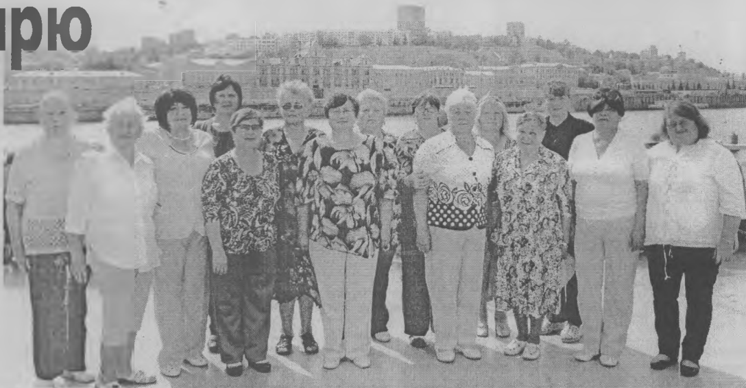
◆ Участники прогульно-экскурсионного рейса.

и полноводной Волги на теплоходе «Отдых-1» 20 августа отправились к этому историческому месту на карте нашей области активисты первичных организаций ВОИ из Тоншаева – 15 человек. И вернулись с