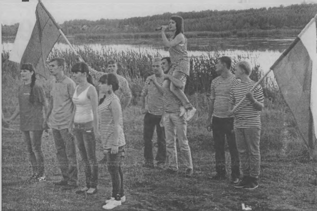
◆ «Славяне» из Буреполома.