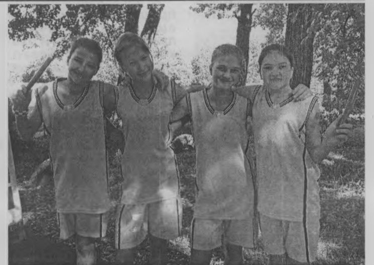
◆ Вторые призеры - ошминские девушки.