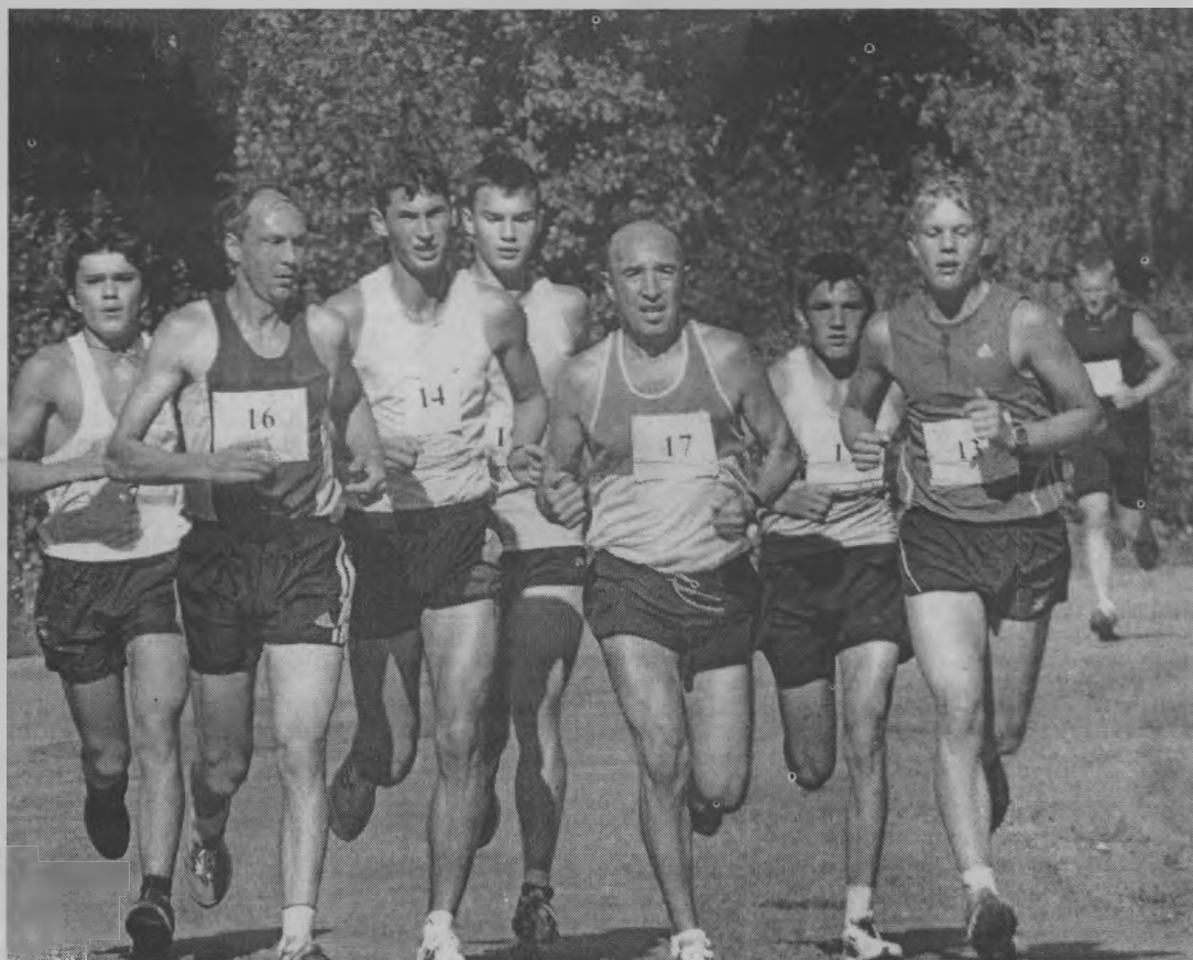
◆ В начале 10-километровой дистанции.