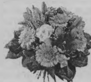
Жена, дети, внуки.

Хотим поздравить с юбилеем И счастья в жизни пожелать, На жизнь не стоит обижаться, Не стоит в жизни унывать. Пусть будет все: гроза, метель, Пусть будет радость и покой, А если очень будет трудно, То знай, что мы всегда с тобой.