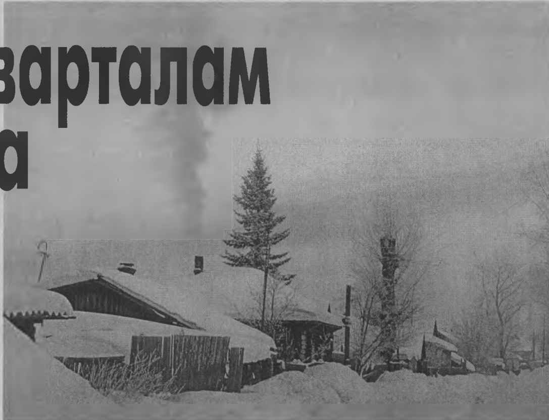
◆ В такие морозы не допускайте перекала печи.