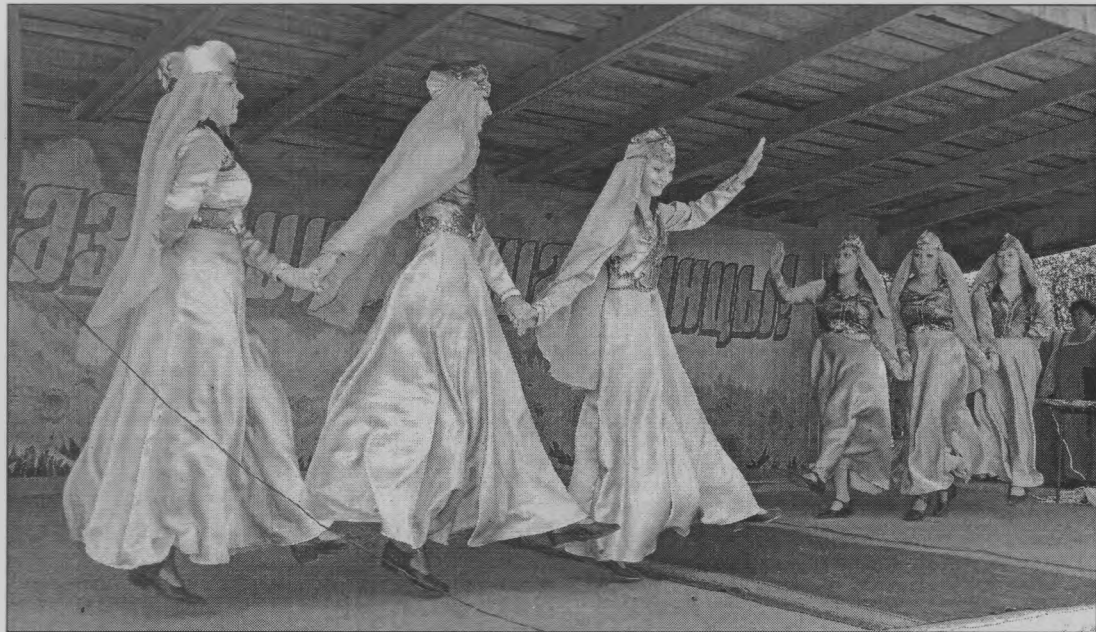
◆ На сцене - танцевальная группа «Ассоль».

ли, насколько краше, благоустроеннее год от года становится их родной поселок. И всеми непременно отмечалось, что главным достоянием его являются люди, с рождения живущие в нем, своим каждодневным тру-