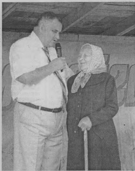
◆ С уважением к юбилярише.

– Мы на этом празднике прекрасно провели время, посмотрели на выступления наших ар-