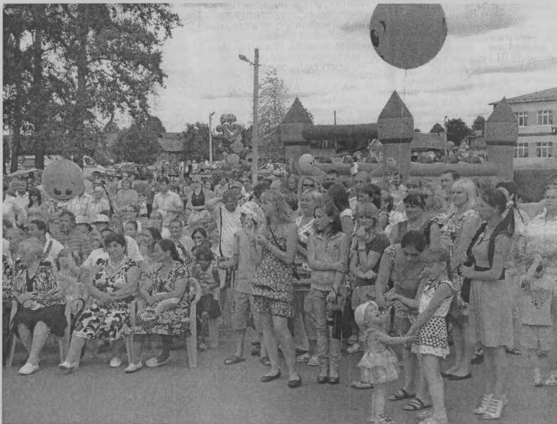
◆ День поселка - праздник всех возрастов.