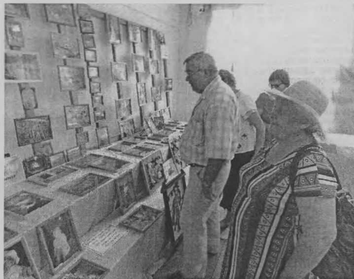
◆ Выставка привлекла внимание.