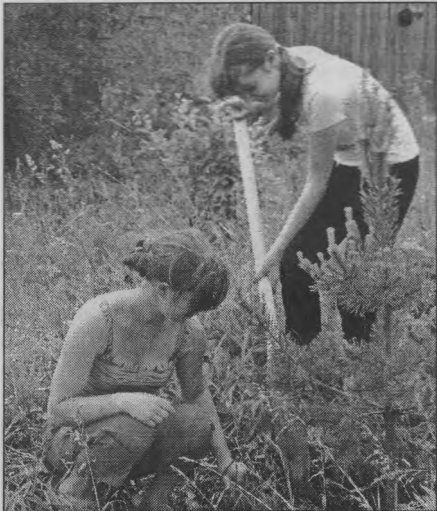
◆ Расти, сосенка, большая!

Наша бригада получила социальный заказ от Пижемской поселковой администрации на посадку деревьев вдоль дороги, ведущей в деревню Пурлы. И вот согласно этому заказу тру-