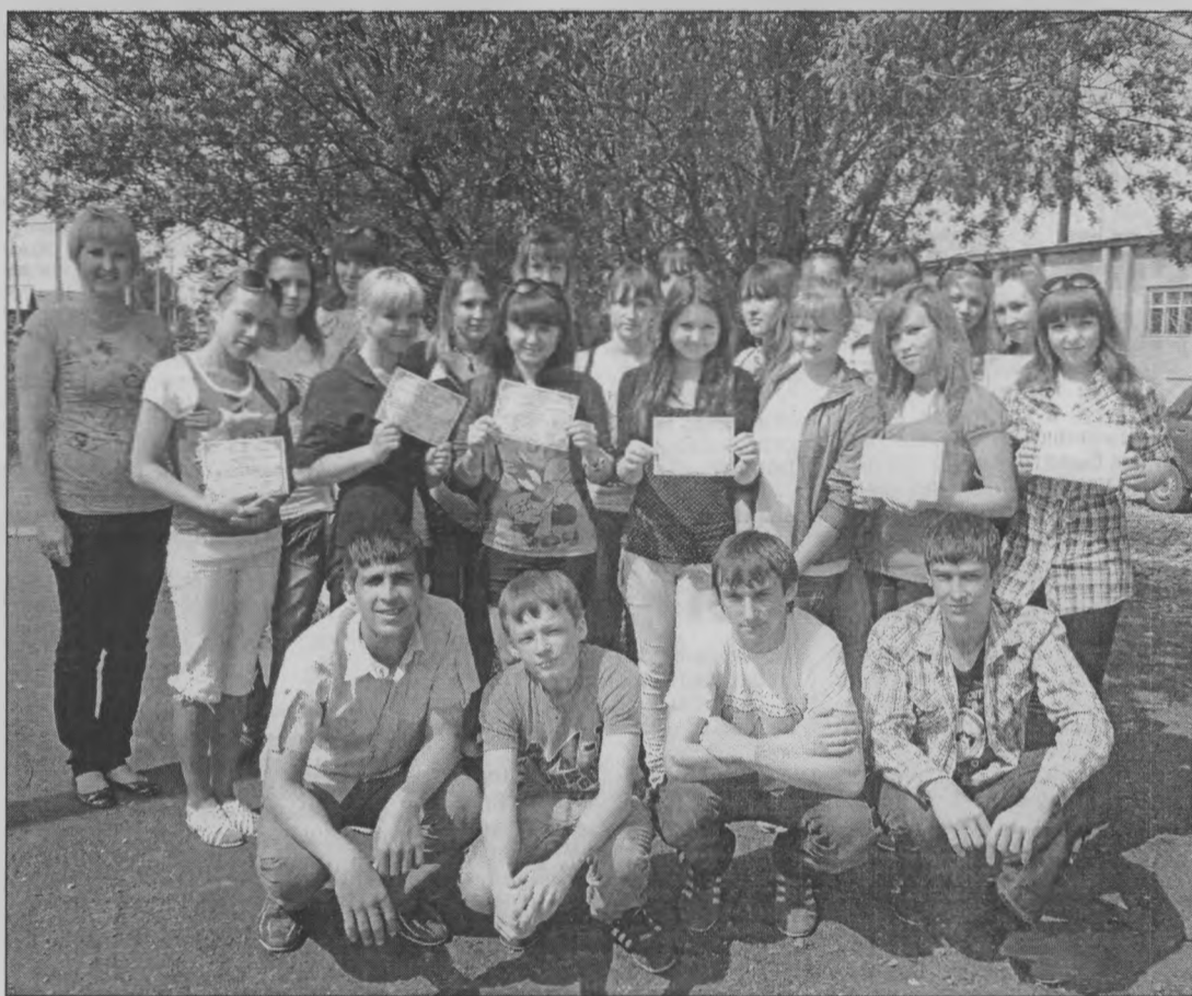
◆ «Урал Мы - вожатые!»

В 2011 – 2012 учебном году на базе Центра детского творчества была разработана программа «Школа вожатского мастерства», которая направлена на развитие лидерского потенциала и раскрытие организаторских способностей детей с це-