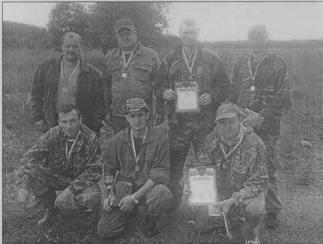
◆ Победители и призеры командного первенства из Шахуны, Пижмы и Тоншаева.

Разыгрывалось и командное первенство, в котором участвовали команды из трёх человек независимо от принадлежности к тому или иному охот-