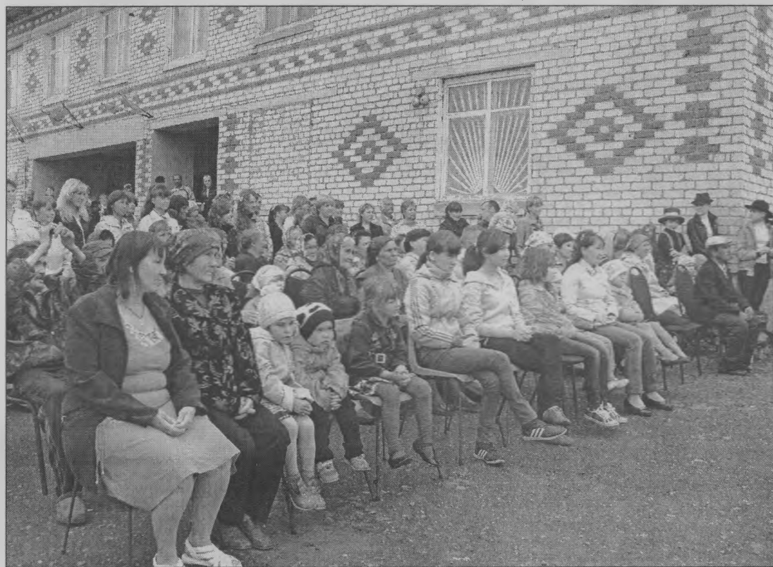
◆ На празднике - и стар, и млад.