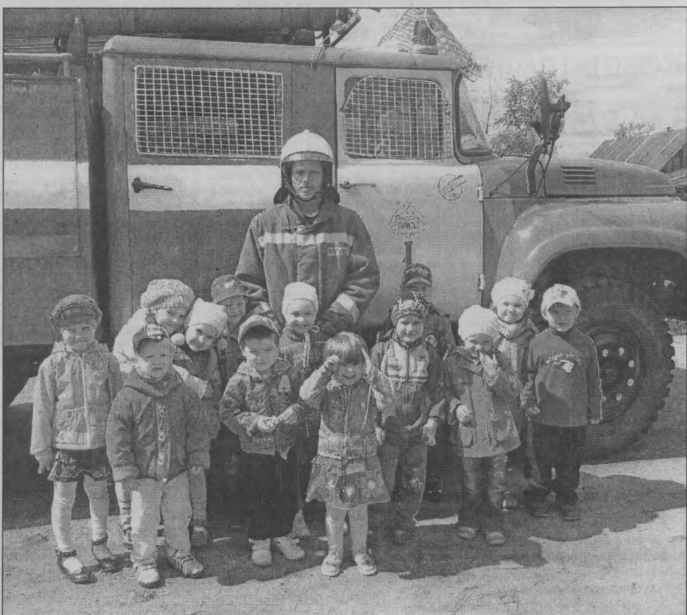
◆ «Мы - в полном восторге!»

Коллектив детского сада «Солнышко», п. Шерстки.