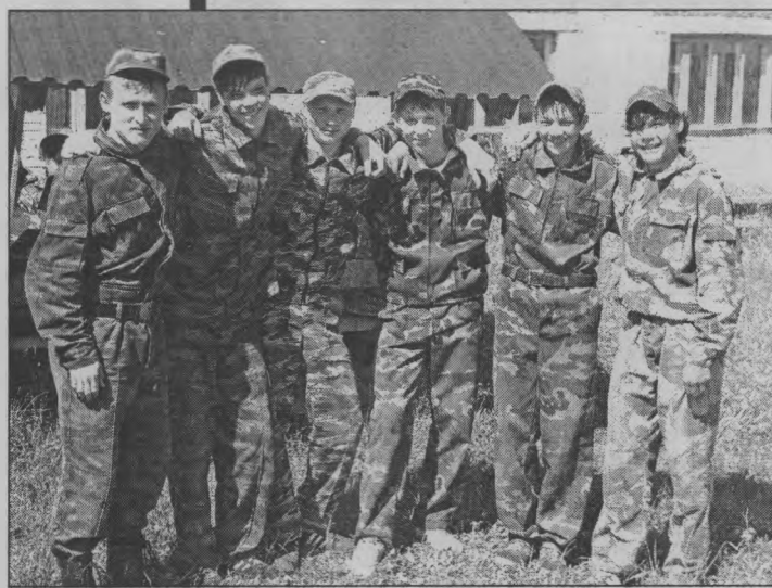
◆ Победители в отдельных номинациях.

Старшеклассники не только учились, но и соревновались, как между собой, так и между школами. В состязаниях по военно-прикладным видам, в которые вошли - спринт, кросс, стрельба, силовая подготовка, разборка-сборка автомата, по-