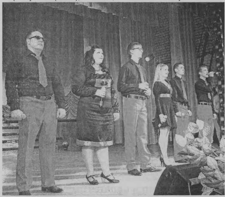
«... вести здоровый образ жизни и заниматься спортом».

районного и Пижемского. Ни одно выступление не было похоже на другое! Каждая команда отличалась от остальных чем-то своим, особенным, тем, чего не было у других. Это проявлялось во всем: и в подборе материала, и в его подаче, и в сценических костюмах... Не зря же каждое выступление провозглашалось дружными аплодисментами. Кстати, это отме-