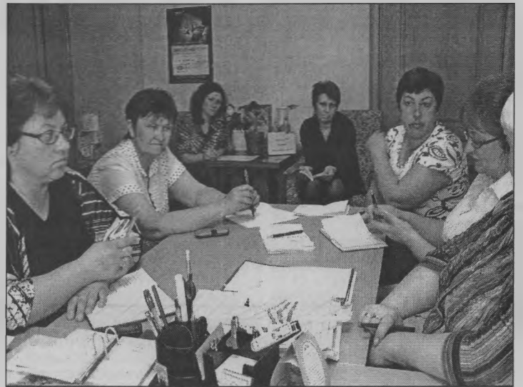
◆ Педагоги - «за» подростковые бригады.