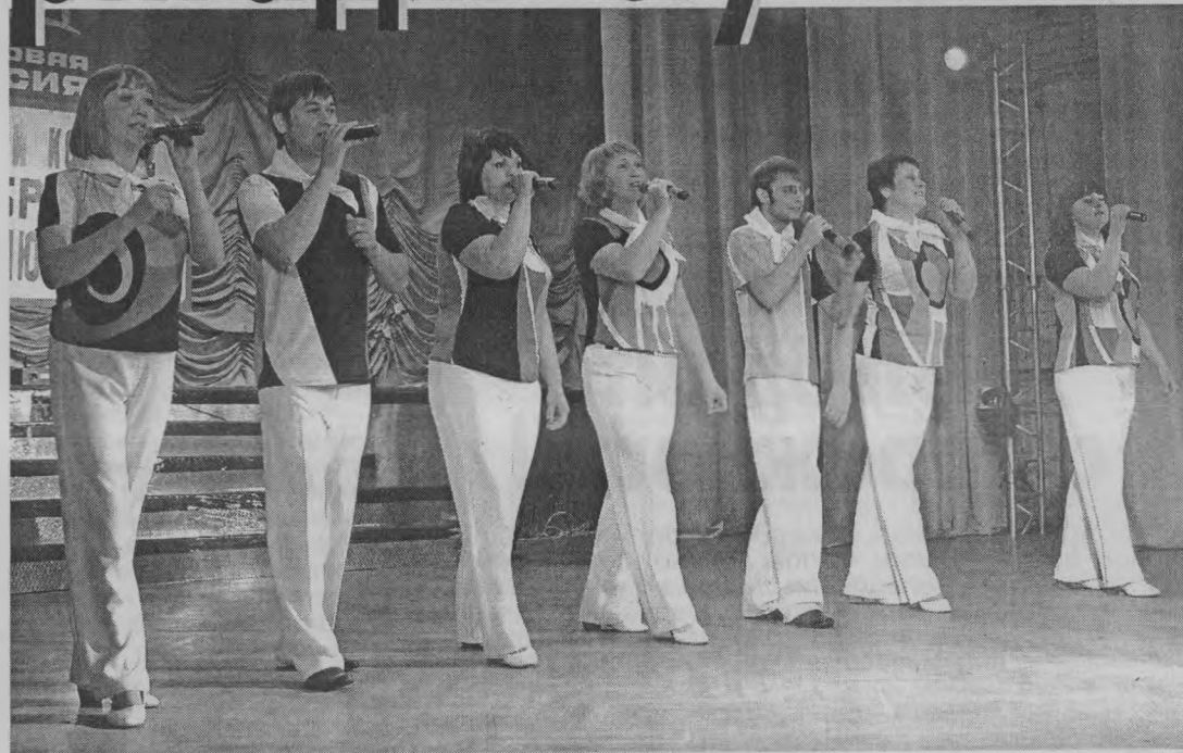
«Хотим жить, любить, творить...»

Тоншаевская публика настало и жюри, восхитившись дружкой нас, северян.