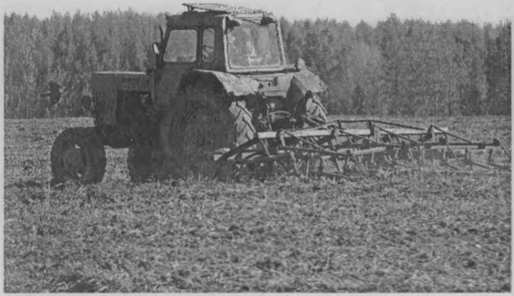
◆ Культивация почвы.