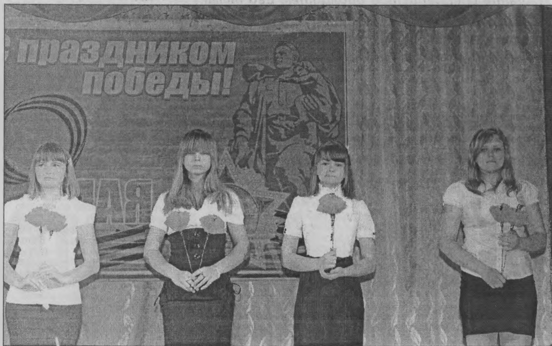
◆ «Мы знаем о войне».