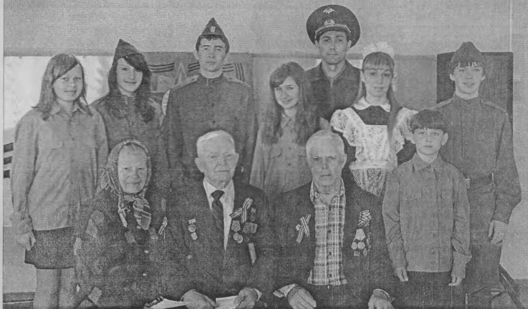
◆ На память с героями войны.