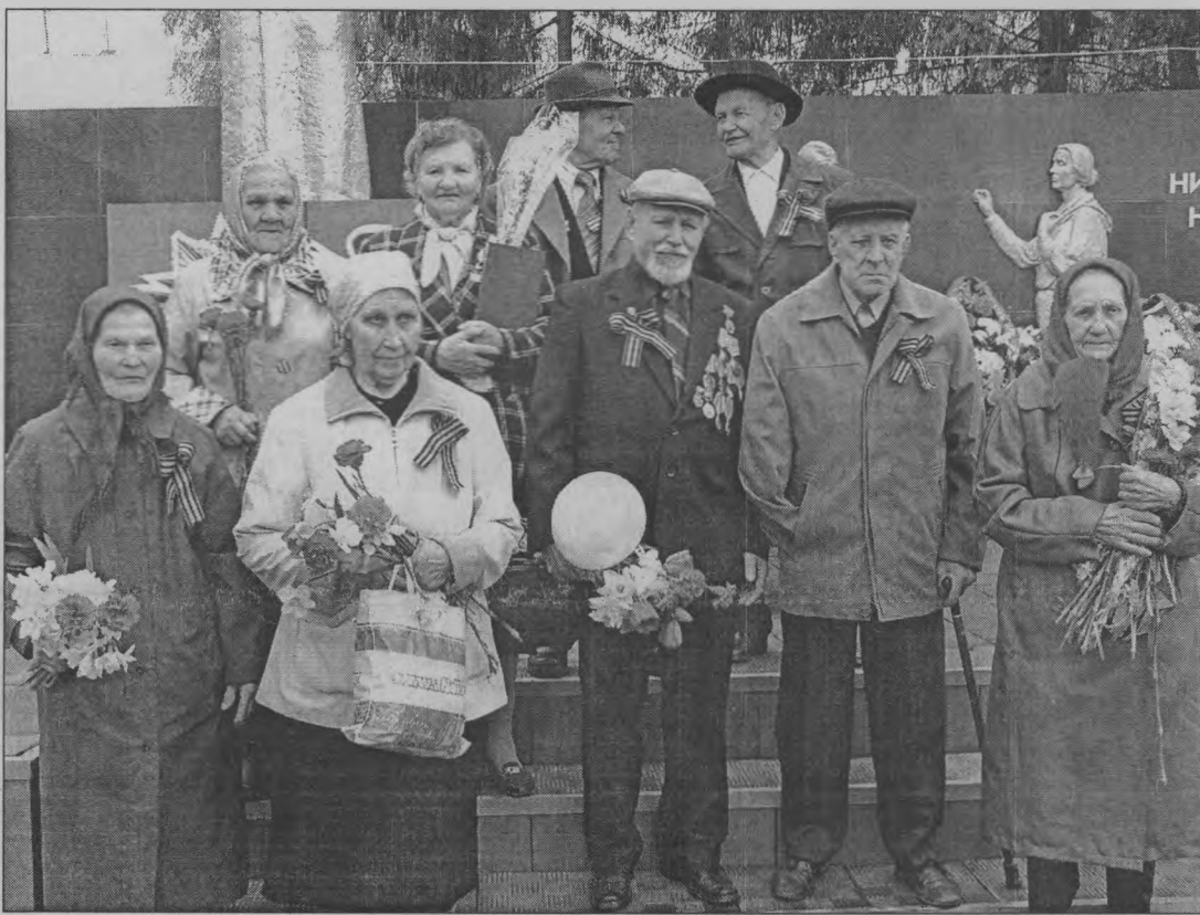
◆ Наши доблестные ветераны.

«Опять весна на белом свете...» - поется в известной фронтовой песне. 67 лет назад закончилась самая страшная и кровопролитная война в истории. И 67-ой год весна ведет от-