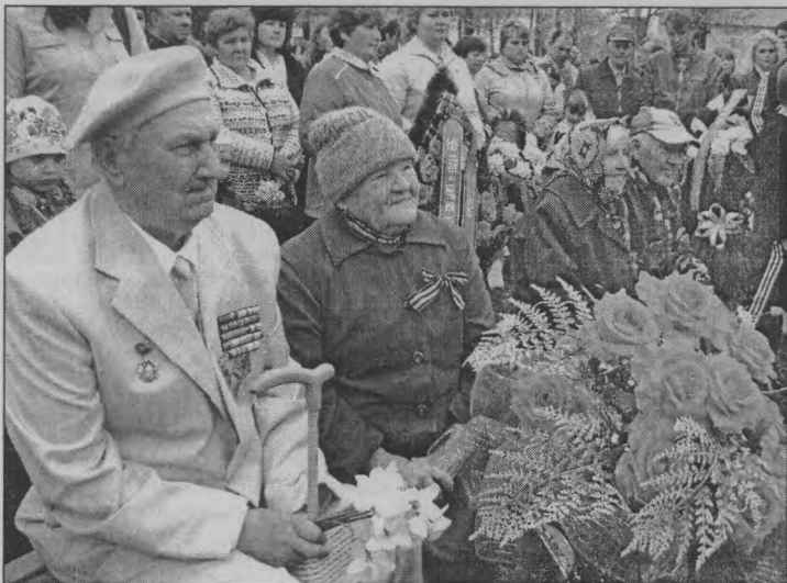
◆ У всех на виду - ветераны (п. Пижма).

ше. Низкий им поклон за то, что мы сейчас живем под мирным небом.