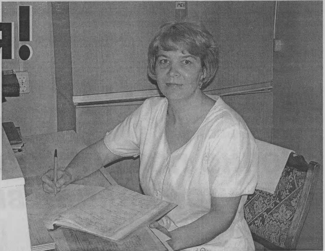
◆ На посту!

От всего сердца поздравляю всех медицинских сестер с их профессиональным праздником.