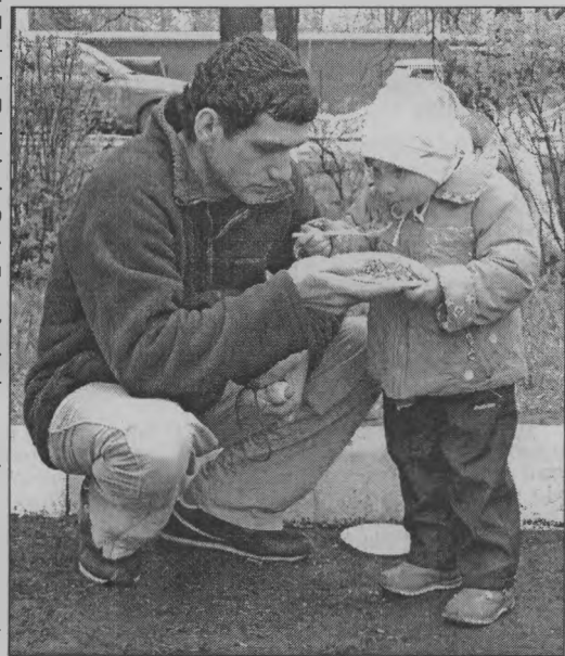
◆ Вкусна солдатская каша!

дей, ведь каждый 9 Мая думает о своих близких, воевавших и не вернувшихся с войны, защищавших свой дом, свою семью,