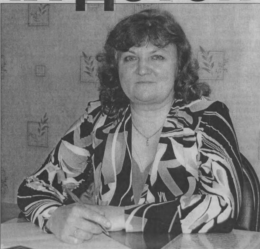
«Пусть каждый ребенок становится лучше, добрее, счастливее».