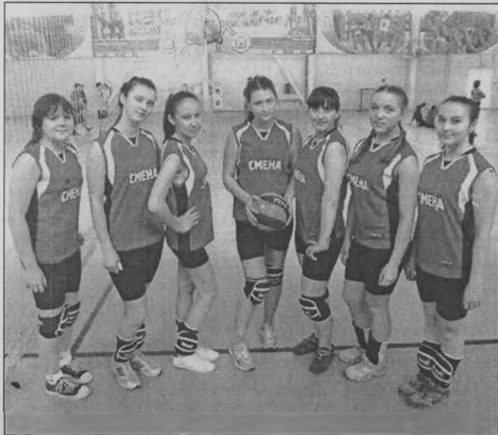
«Смена» в полном составе.

Прошел турнир по волейболу на призы физкультурно-оздоровительного комплекса «Атлант» г. Шахунья. Соревновались девушки 1994 года рождения и моложе.