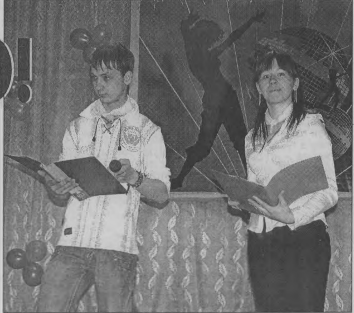
◆ «Курить - здоровью вредить» - убеждены учащиеся вечерней школы.

Тоншаевцы устроили токшоу по принципу телепередачи «Пусть говорят». Их тема звучала так: «Сквернословие – оружие массового поражения». Эта команда подняла настроение своими «учеными мужами», «докторами наук», «Андреем Малаховым»... Выступления агитбригад