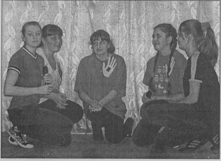
◆ «Протянем руку помощи» - обнадеживают ошминцы.