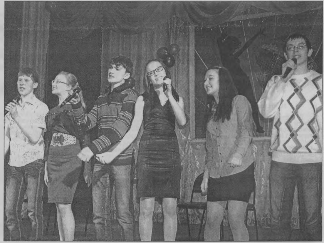
◆ «Давайте говорить на чистом языке!» - призывают тоншаевские школьники.