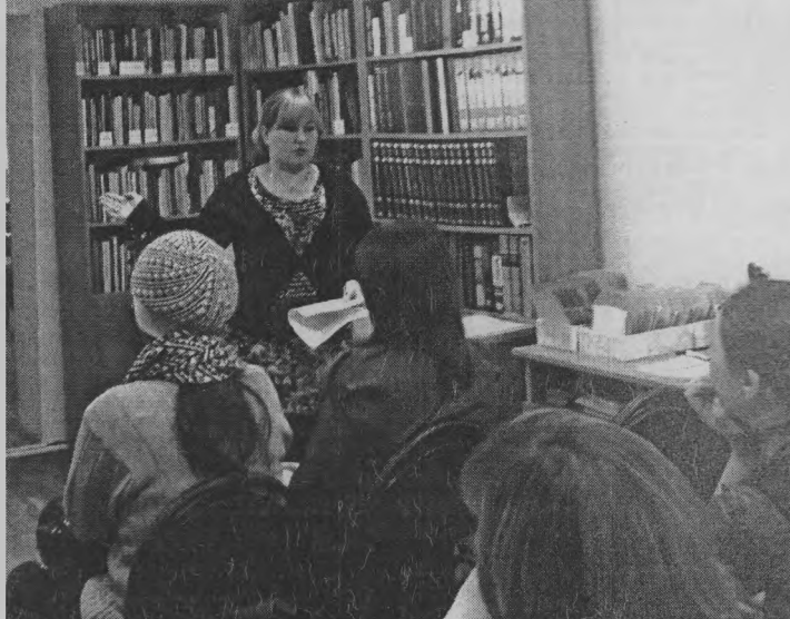
Во время занятия.