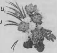
Муж, дети, внуки.

В этот день позабудь, сколько лет позади, Не грусти ты о них с сожалением, До земли ты поклон наш сердечный прими За любовь, за добро, за терпение. Мы очень желаем, чтоб ты не болела, Чтоб беды, печали тебя обошли, Чтоб наша любовь твоё сердце согрела, На радость и счастье нам долгие живи!