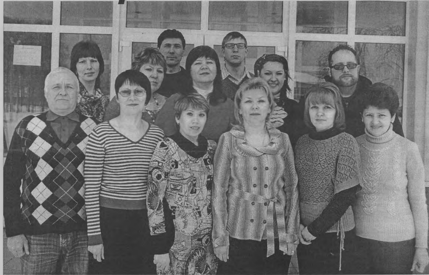
◆ Творческий коллектив Пижемского Дома культуры «Юбилейный».

Вчера в Нижегородском цирке состоялось торжественное мероприятие по случаю празднования Дня работника культуры. Началось оно с официальных поздравлений и награждения лучших учреждений и работников культуры, а закончилось впечатляющим цирковым представлением.