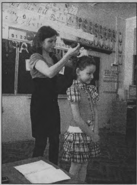
«Сделаем красивую прическу».

нивались впечатлениями за чашкой вкусного чая.