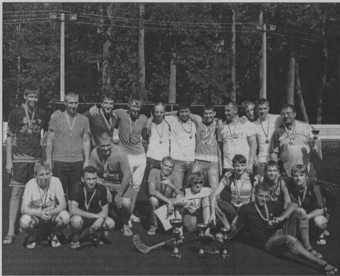
◆ Команда победителей.