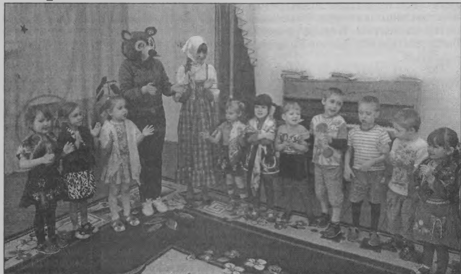
◆ В гостях - Маша и медведь.

В детском садике «Аленушка» п. Кировский провожали зимушку-зиму.