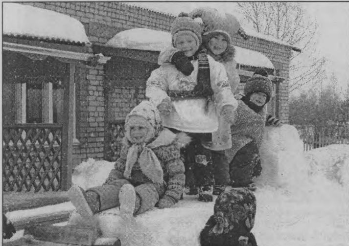
◆ На сказочной печке.

В последние годы в российской системе дошкольного образования произошли определенные позитивные перемены: обновляется содержание образования и воспитания детей. Появилось несколько новых комплексных программ (например, программа «Истоки»), которые с успехом используются во многих дошкольных учреждениях района. Мы считаем, что приобщение детей к народной культуре является средством формирования у них патриотических чувств и развития духовности.