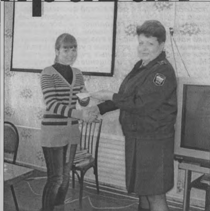
◆ Вручается основной документ человека.