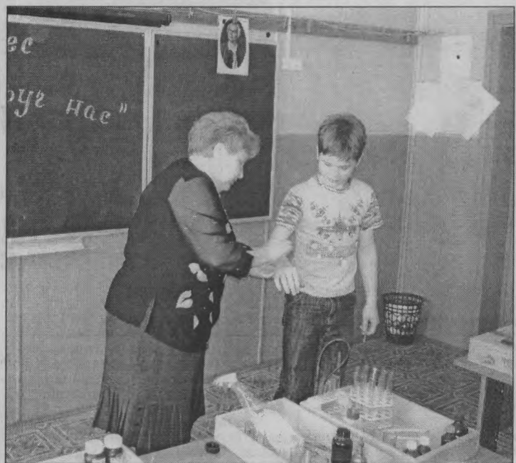
◆ Интересны же опыты по химии!

В этом году празднуется 300-летие со дня рождения велико-