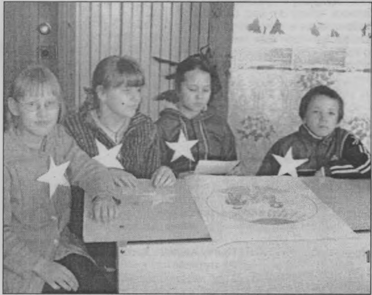
◆ Во время знакомства со своими правами.

А в заключение под дружные аплодисменты всех при-