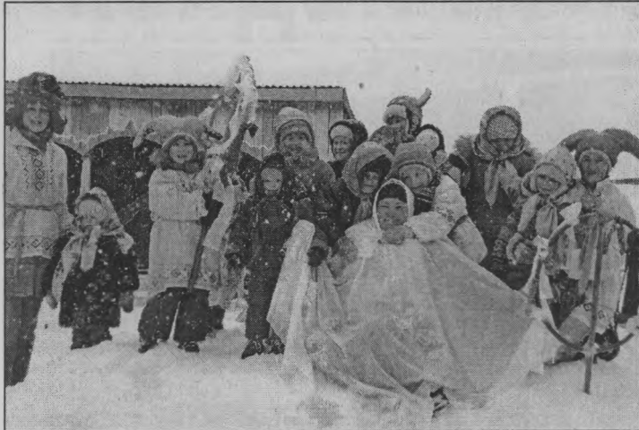
◆ Любим и зиму, и весну.

Давно забыты и не употребляются в разговорной речи ста-