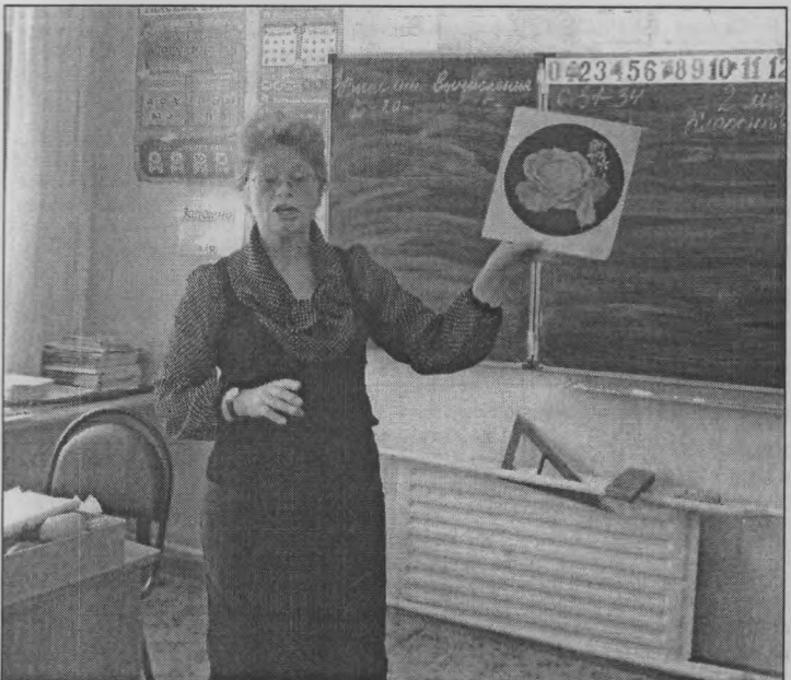
◆ «Это растение культурное?»

Т. ТЕН, учитель географии Тоншаевской школы.