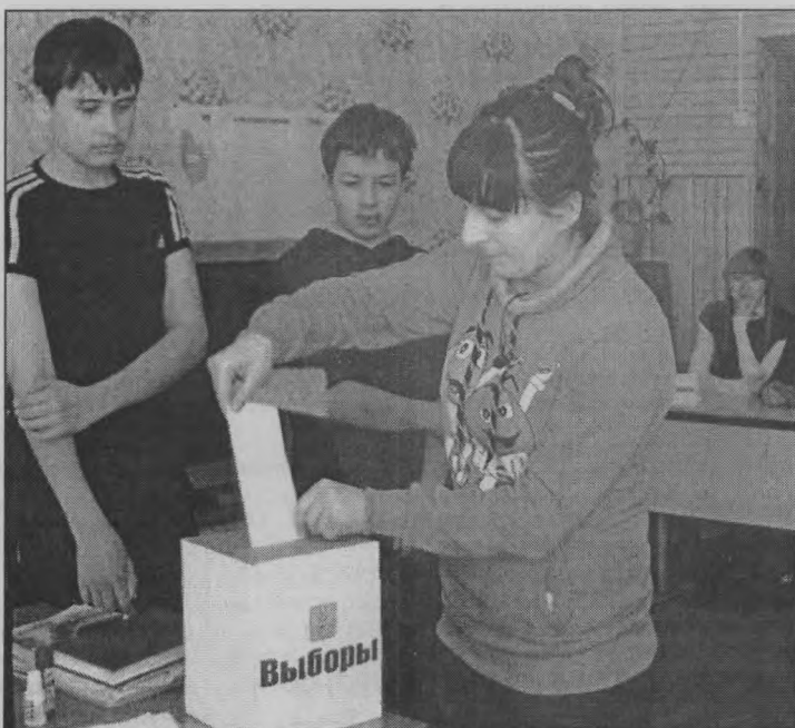
◆ Пока играем, а скоро будем голосовать по-настоящему.

В процессе игры-тренинга «На избирательном участке»