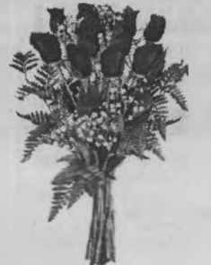
Муж, дети, внуки, правнуки.

Благодарим тебя, родная, Что есть у нас на свете ты, На всех детей, внучат хвастает Твоей любви и доброты. Ты окружила нас заботой И забываешь о себе, Всегда в делах, всегда в работе, Спасибо, милая, тебе. Сказать, как нами ты любима - И слов таких на свете нет, Ты нам всегда необходима Сейчас и через много лет. Желаем жизни долговечной, Пусть счастьем наполнится твой дом, Улыбок, радости сердечной, Здоровья и удач во всем.