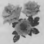
Жена, сыновья, теща.

Счастья тебе, наш любимый, Радости на многие года. Будь всегда и всюду справедливым, Честным и отзывчивым всегда. Щедрот тебе людских и вдохновенья, Крепкого здоровья на весь век, Пусть он будет добрым, юбилей твой, Для тебя, наш милый человек!