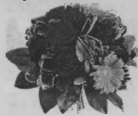
Жена, дети, внуки.

Любимый наш, считать не надо годы, Хоть их немало, все они полны Трудом, любовью и о нас заботой. Как низко поклониться мы должны Тебе за доброту твою и ласку! Тебя, наш милый, ценим, бережем, И твоё сердце чутко, нежно, властно, Нас согревая, освещает дом!