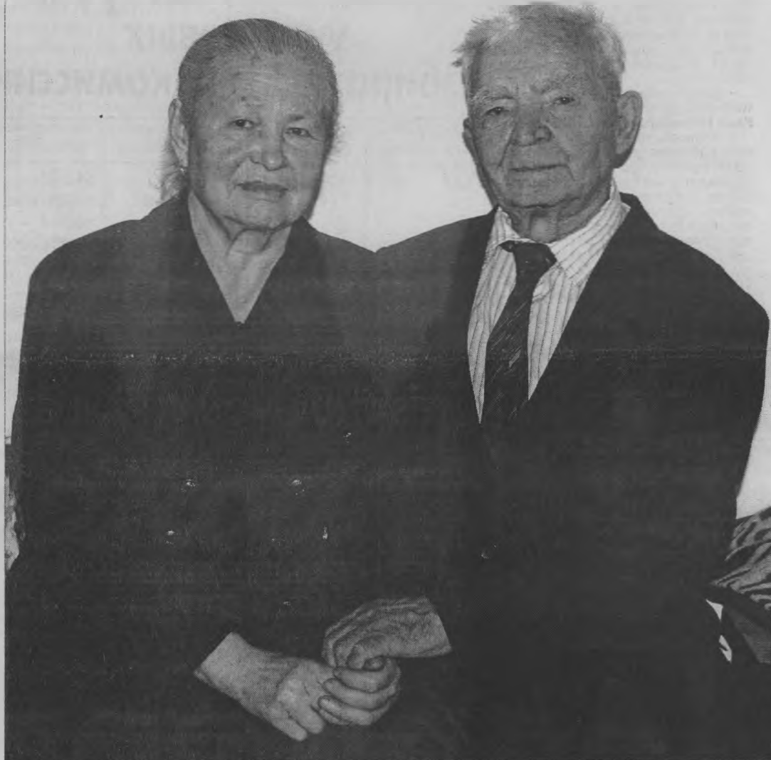
◆ Рука в руке и в счастье, и в печали.