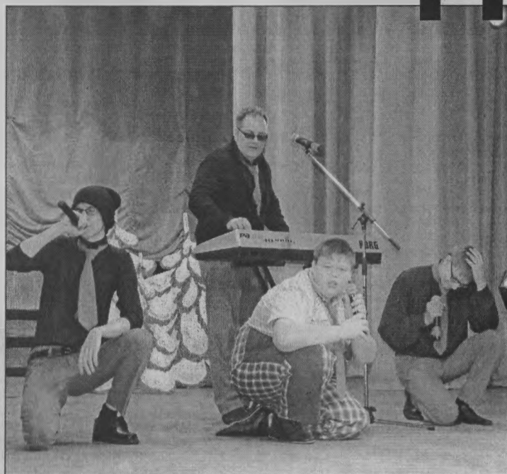
◆ «Свою песню посвящаем мэру Пижмы».