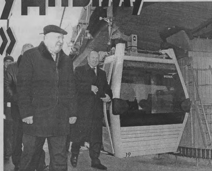
◆ На открытии канатной дороги Нижний Новгород-Бор. Нижегородская канатная дорога вошла в Книгу рекордов России как уникальный инфраструктурный проект - канатка с самым большим пролетом над водной поверхностью. Рекорд зафиксирован 12 октября 2012 г.

хватает на все районы, к 2020 году в области не должно остаться дотационных муниципальных образований, а люди в