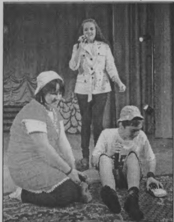
◆ Веселые дети «Вовика».

В музыкальном плане мне понравилось Шайгино. У тоншаевцев следует отметить большое количество парней. Ведь, как правило, мальчишки не очень активно откликаются на участие в таких мероприятиях. У Шерстков, считаю, все было слажено: и шутки, и музыка. Гагаринцы тоже в принципе молодцы, просто они помладше, поэтому чувствовалось их стеснение. Да в целом все хорошо выступали.