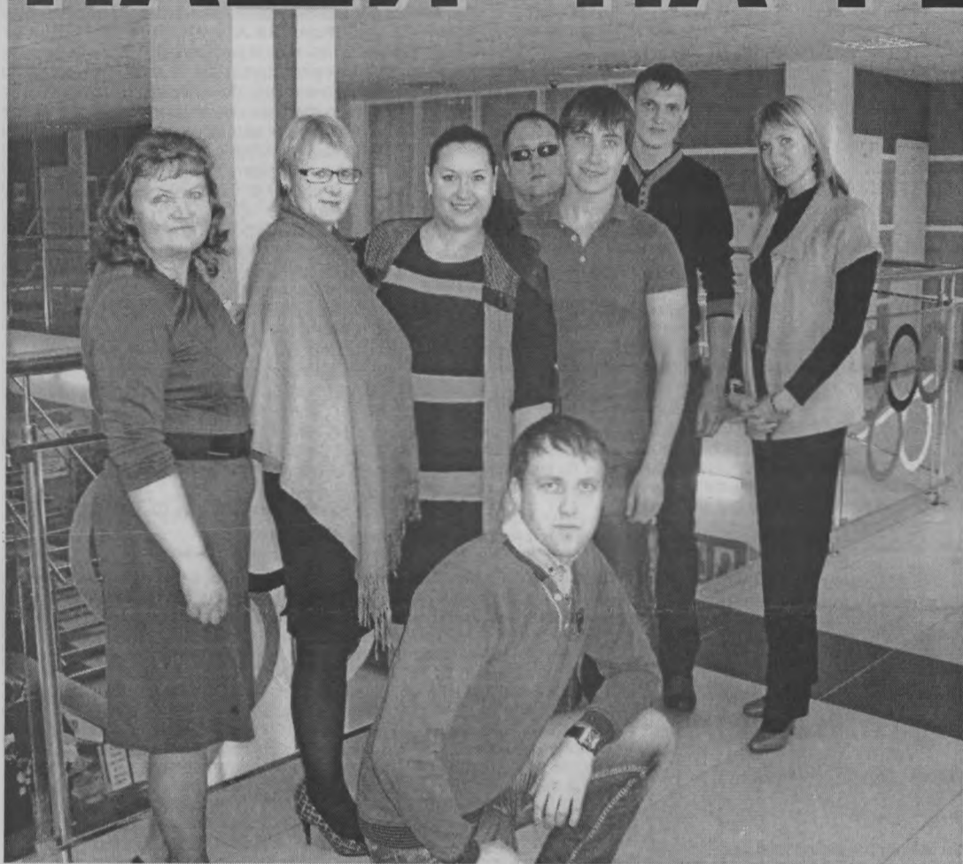
◆ Тоншаевские авторы и исполнители.

В г. Урень состоялся межрайонный литературно-творческий фестиваль имени местного поэта К. В. Мартовского «Полет стиха и поступь прозы», который был организован Уренским отделом культуры, информационных технологий и молодежной политики и Уренской централизованной библиотечной системой.