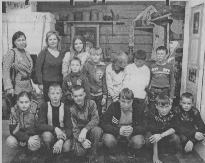
«А на память мы сфотографировались».

Но больше всего порадовала детей выставка техники. В