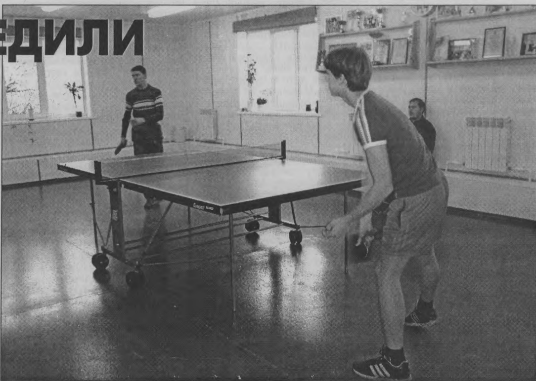
♦ Отдающие предпочтение настольному теннису.

Но, как говорится, для большинства важна не победа, а участие. Потому как игра в теннис ничего кроме пользы и здоровья не приносит. Оказывается, этот вид спорта помогает восстановить зрение тем, кто близорук или дальновзорок, кто подолгу сидит за компьютером. Спо-