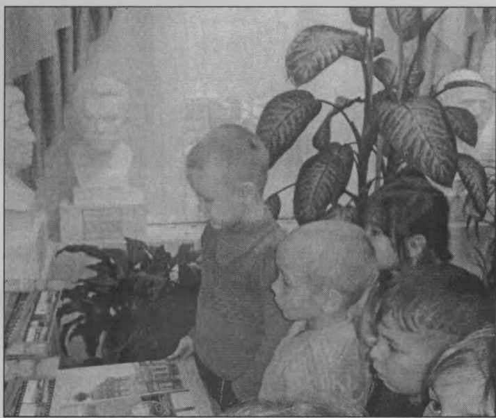
◆ Как интересно!

«Много сотен лет назад наш посёлок выглядел совсем по-другому. Здесь тоже жили люди, но жили они не так, как мы. У них не было машин и электричества, компьютеров и телевизоров... Сейчас мы откроем эту