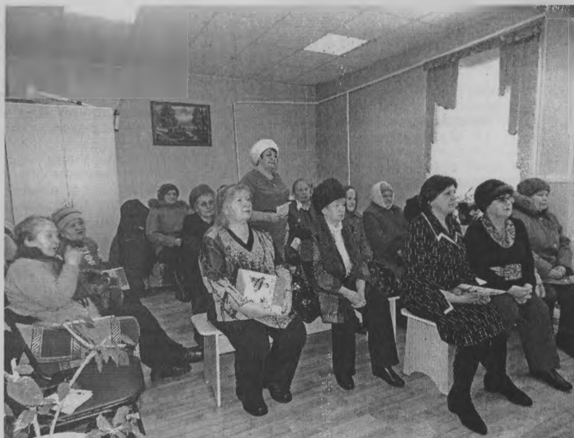
◆ Для кого открыты двери центра.

«спасательной соломинкой» в жизни многих престарелых людей. Но теперь, чтоб заселиться в анкет, придется столкнуться с неадекватным, в котором