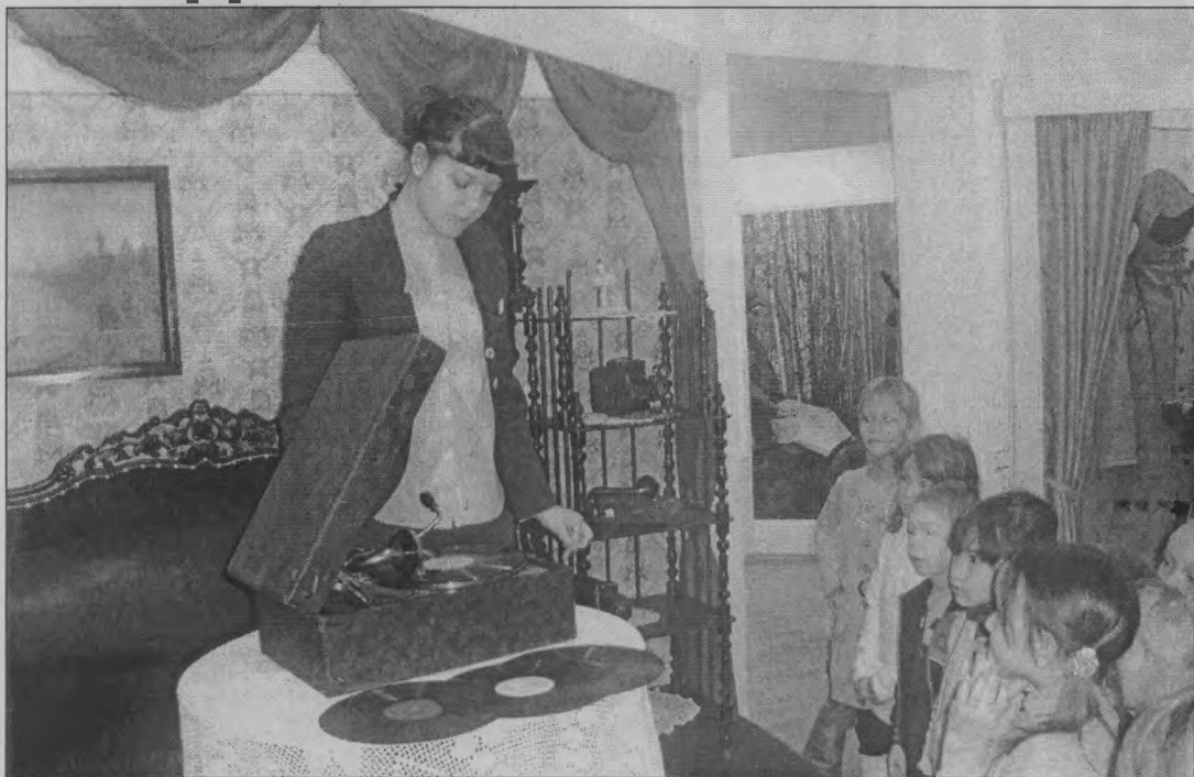
◆ Летящая музыка... из патефона.

Когда вы последний раз были в Краеведческом музее? Давно? Значит, самое время отправиться туда и непременно со своим ребёнком.