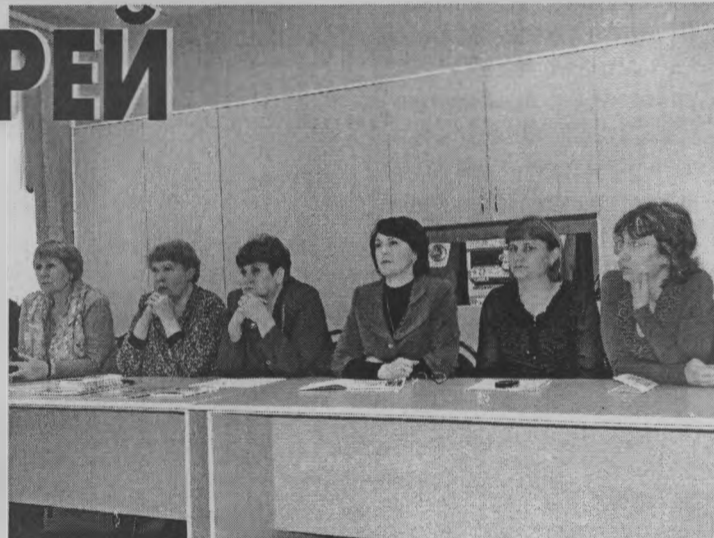
◆ Есть вопросы? Отвечаем!

Дом-интернат в Шайгино тоже является своеобразной