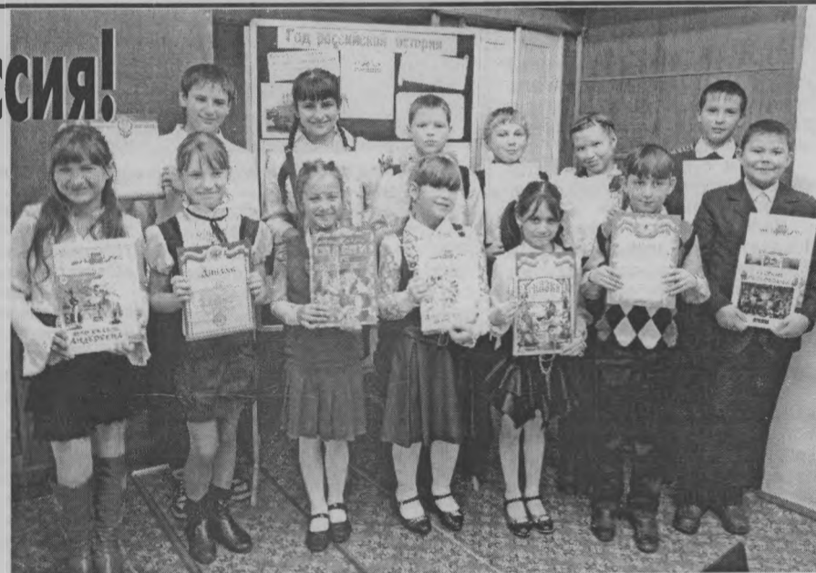
◆ Самые лучшие чтецы.