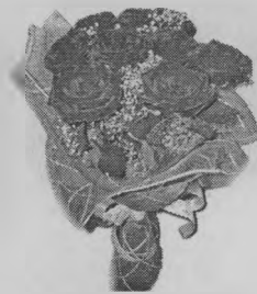
Жена, дети, внуки.

У тебя сегодня юбилей, Сердечно поздравляем! Здоровья, счастья, светлых дней Мы от души желаем! Пусть ангел жизнь твою хранит, Болезни пусть тебя не знают, Пусть горе от тебя бежит, А радость пусть не забывает. Пусть в доме будет хлеб и соль И гости приезжают. Живи и здравствуй целый век, Любимый нами человек!