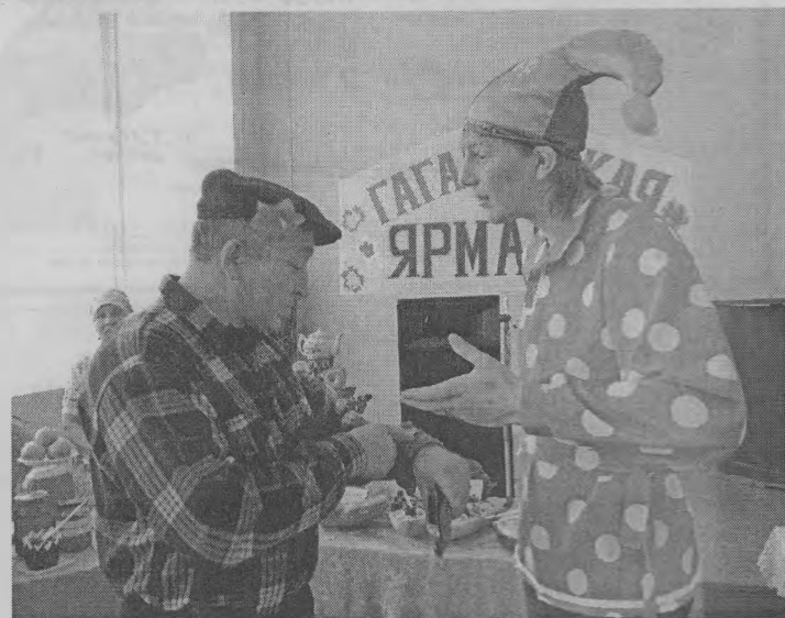
◆ «Давай обсудим!»