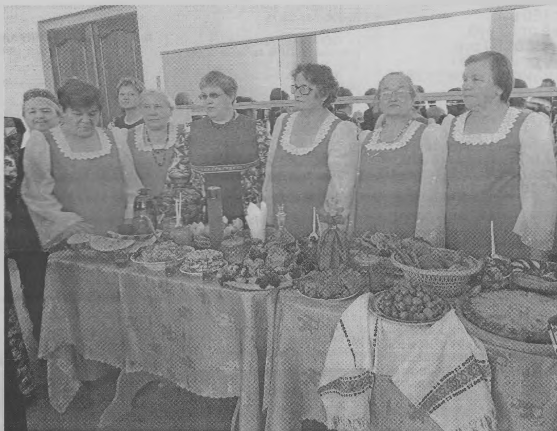
◆ Всем на диво - блюда татарской национальной кухни.

приготовлены руками отменных хлебосольных хозяек.