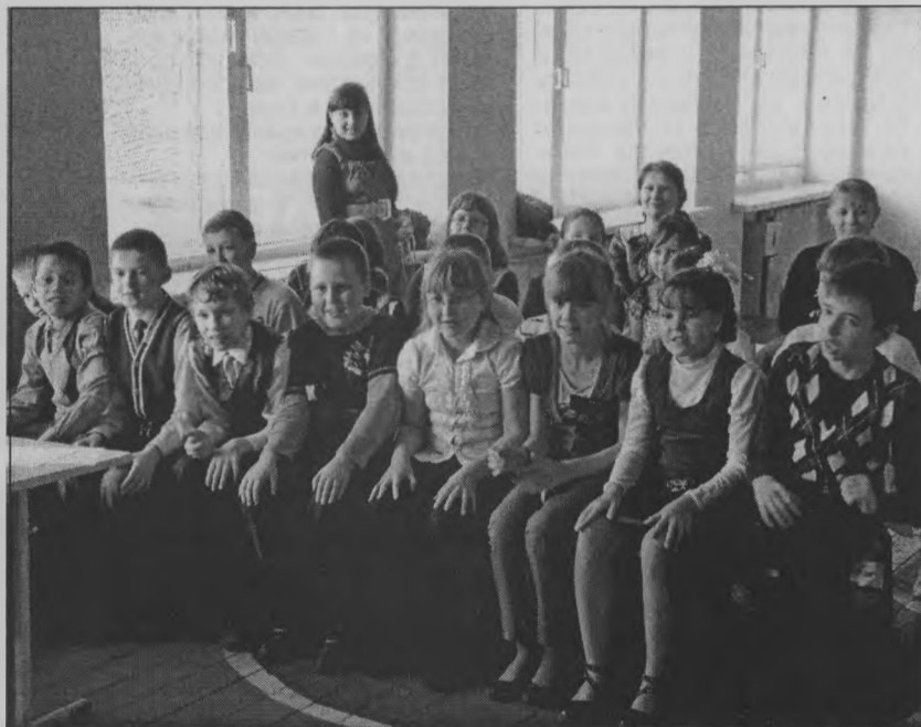
◆ Команда 5 «а» класса.