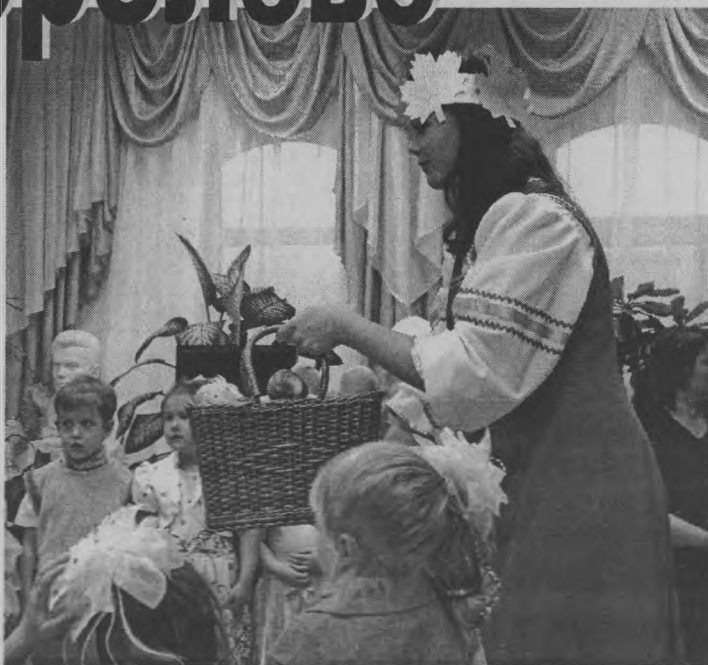
◆ Осень щедра на подарки!

не в привычной для детворы обстановке садика, а в музее.