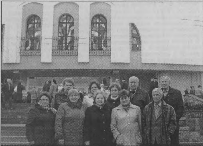
◆ Участники памятной поездки.

- Мы с большим интересом следили за выступлениями артистов и дрессированных животных, словно дети – дружно ап-