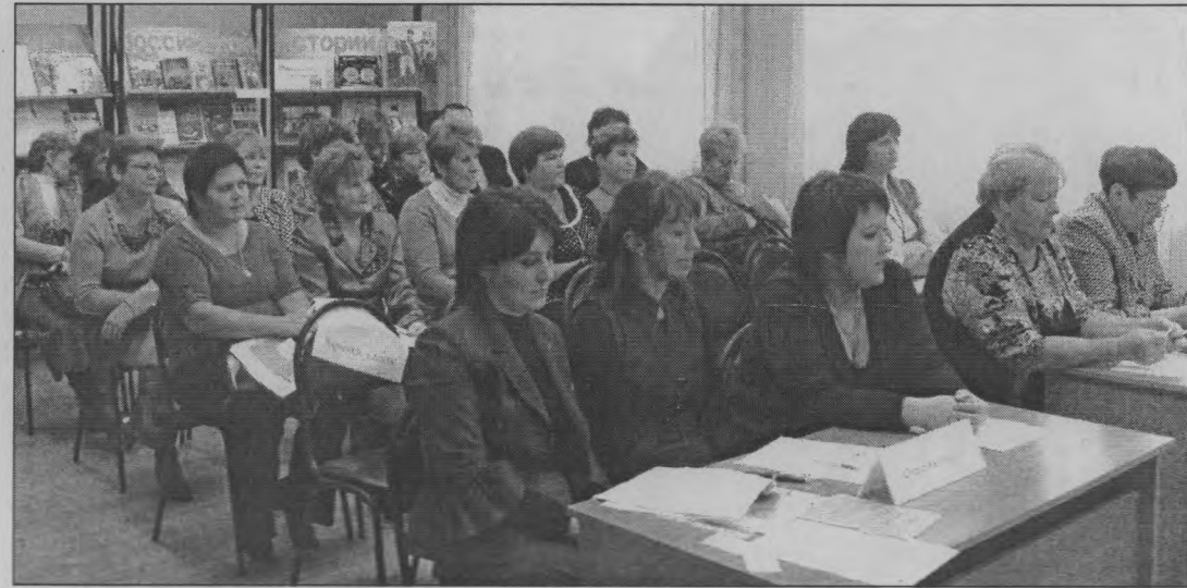
◆ Делегаты конференции.