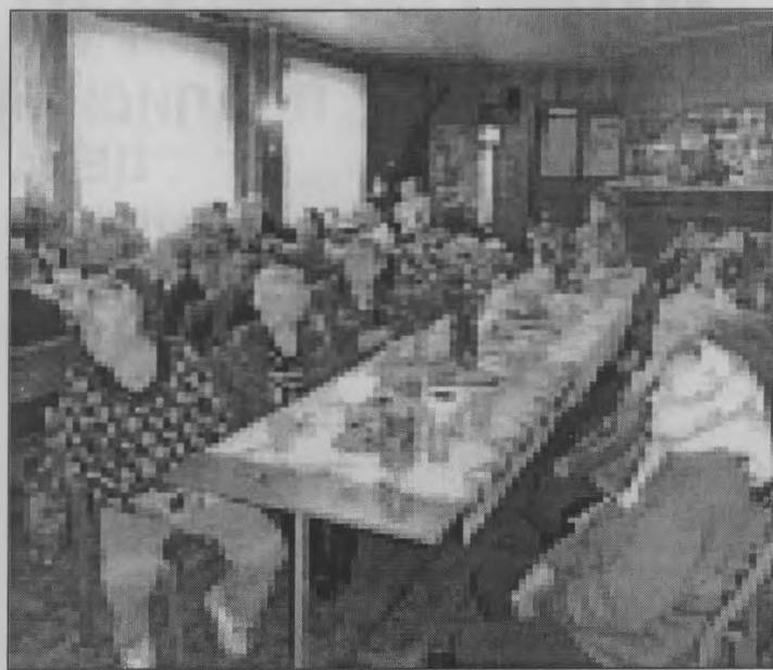
◆ За праздничным столом.

Хочется сказать огромное спасибо всем тем, кто помог в