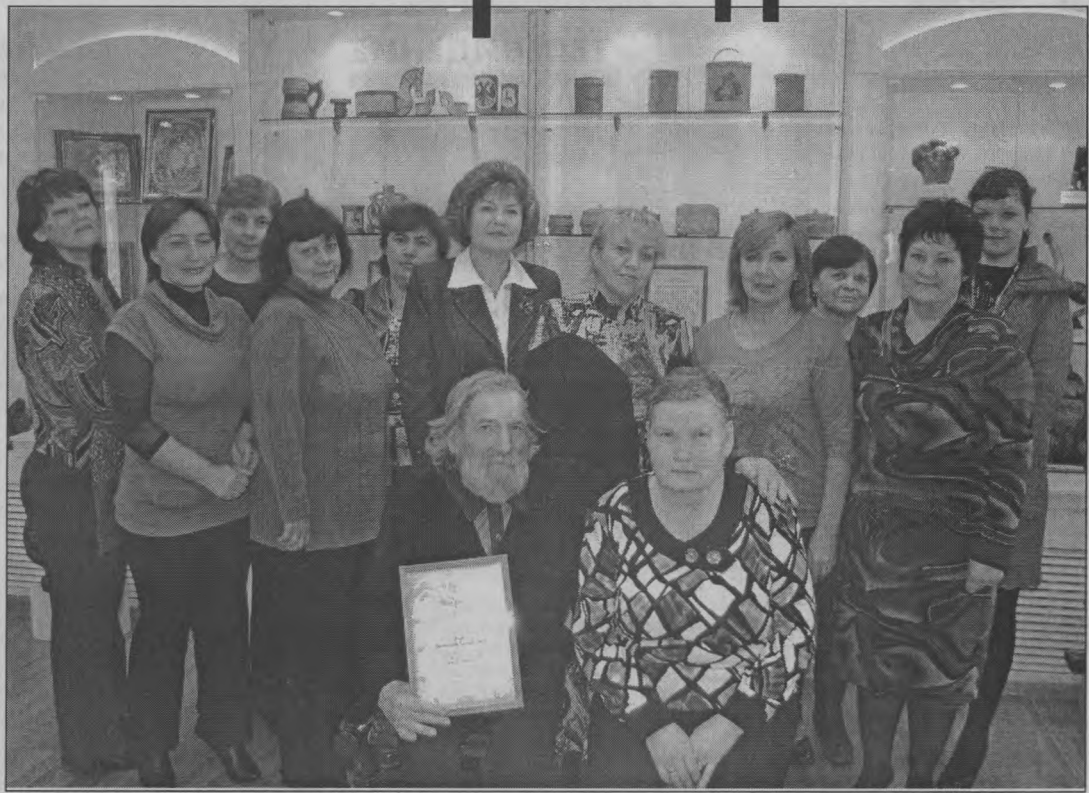
◆ На память о творческой встрече.

Одним из направлений в деятельности музея является установление контактов с посетителями с учётом их потребности в информации, обучении, развитии творчества, в общении и досуге. Важной задачей является воспитание музейных