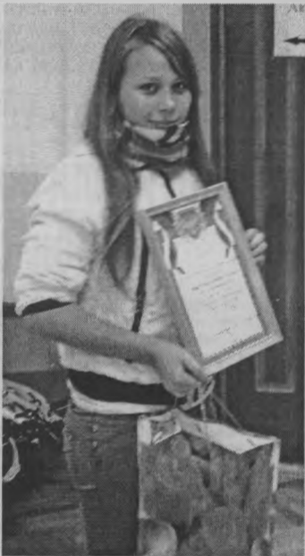
◆ Второе место у Шайгино.