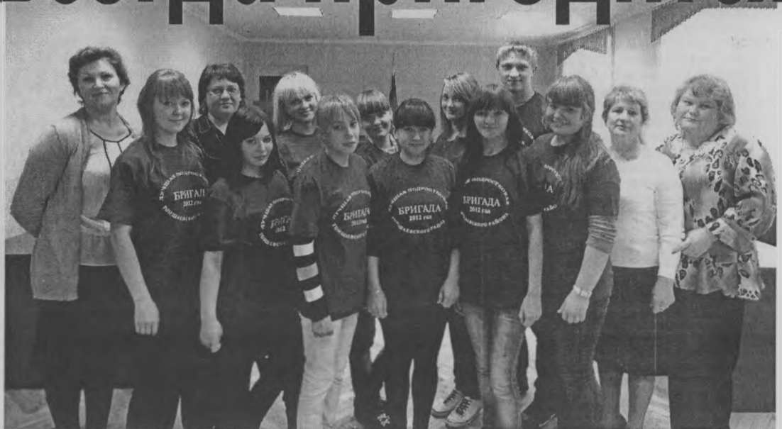
◆ Лучшая подростковая бригада - в Тоншаеве.

ребята стали дисциплинированнее и дружнее, и выразила всем благодарность за работу. А потом начался просмотр видеороликов и электронных презентаций о том, что делали бригады. Представление материалов шло с комментариями руководителей коллективов.