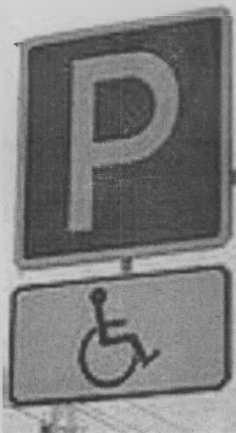
Подготовила Е. РЫКОВА.

Другим автомобилям эти места нельзя занимать. За нарушение правил остановки или стоянки транспортных средств в местах, отведенных для остановки или стоянки транспортных средств инвалидов статья 12.19 ч.2 КоАП РФ предписывает наказание в виде штрафа от 3 до 5 тысяч рублей.