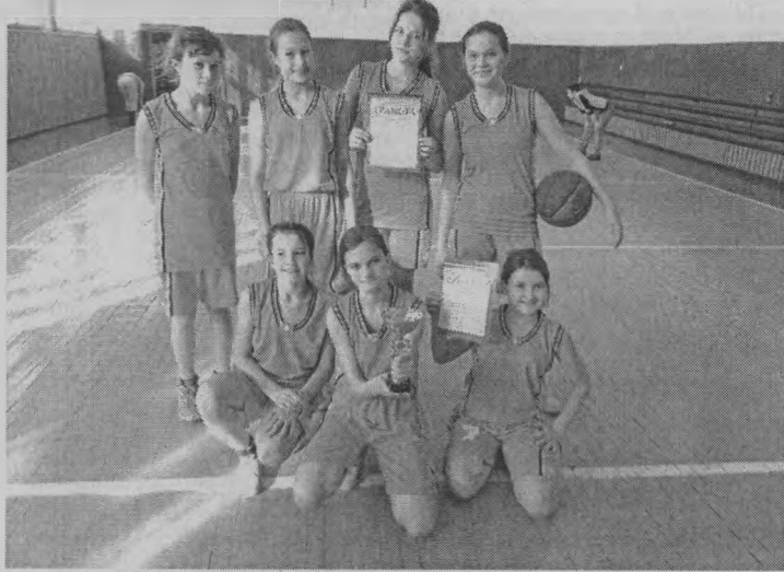
◆ Ошминские баскетболистки.

По итогам проводившихся соревнований по сумме призовых мест по всем видам спорта