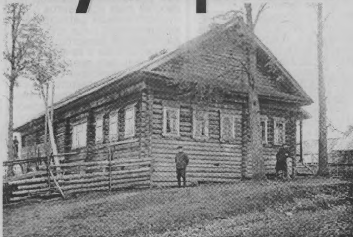
◆ Луговской маслозавод.

В это же время в селе Одошнур (будущем посёлок Бурепол) открывается лесозавод на базе Ветлужского лесосовхоза. Именно на его базе в 1927 году было организовано управление мест заключения лагеря «Унжлаг» (в него входили все УМЗ заволжской стороны). В основном вольнонаёмный труд был заменён трудом заключённых. Это стало началом исправительных лагерей на территории нашего района. Так как в селе не было железнодорожной станции, то приёмный пункт и