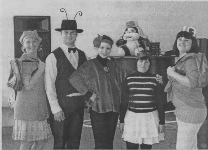
◆ Сказочные учителя.

Веселые конкурсы для ребят подготовили также другие