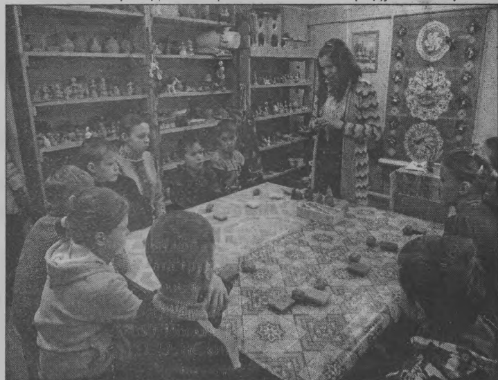
◆ «Сейчас будем лепить из глины».