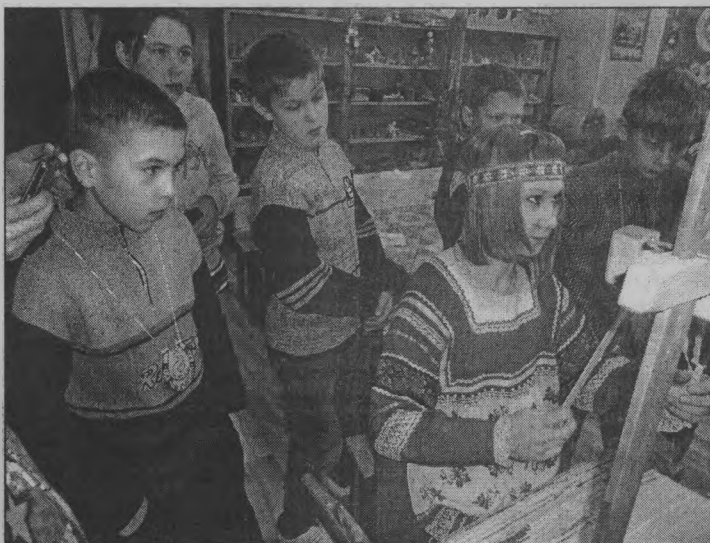
◆ Узнали, как раньше ткали.

нас физкультурно-оздоровительный комплекс «Спарта». Ледовая арена и тренажёрный зал оставили неизгладимые впечатления, ведь некоторые из ребят впервые встали на коньки, попробовали свою силу и сноровку на тренажёрах.