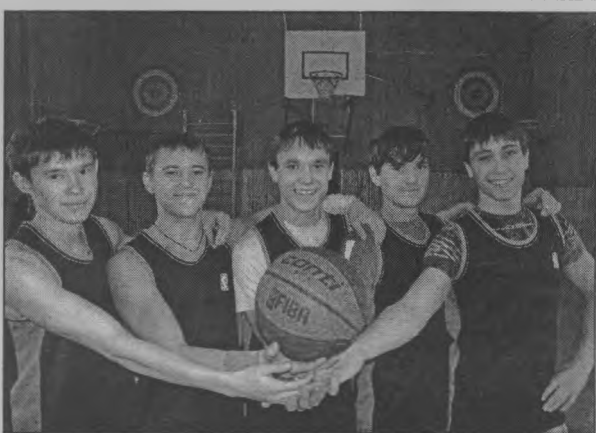
◆ Стартовая пятерка команды-победительницы.