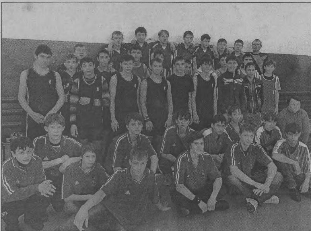
◆ Фото на память.

В декабре в рамках «Президентских игр» в р.п.Тоншаево прошли районные соревнования по баскетболу среди юношей 1995-96 года рождения.