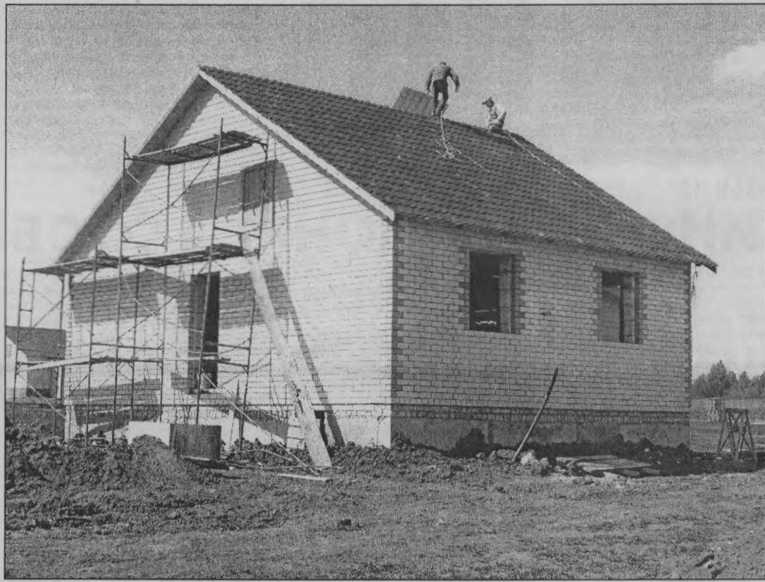
◆ Дома для молодых специалистов ООО «МСО-Север» строят основательно и надежно.

Дома типовые - 65 квадратных метров, трехкомнатные, полностью благоустроенные. Только в этом году есть отличия. И они сразу же бросаются в глаза. Строительная организация ООО «МСО-Север», выигравшая конкурс, выбрала более качественную, более подходящую для наших северных условий прожигания технологии. Дома возводятся из газосиликатных блоков с использованием утеплителя, пенопласта, и снаружи обкладываются облицовочным кирпичом. Строится основательно, надежно, и соответ-