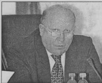
В. П. Шанцев.

Совершая деловую поездку в Воскресенское, губернатор области В. П. Шанцев провел встречу с редакторами газет северных районов.