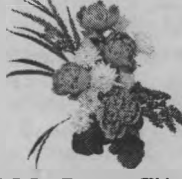
Коллектив ООО «Вираз-ТН»

С юбилеем поздравляя, Желаем только одного - Чтоб места не было печали Под крышей дома твоего. Живи себе и всем на радость, Не торопи свои года. Здоровой, бодрой и счастливой Желаем быть тебе всегда!