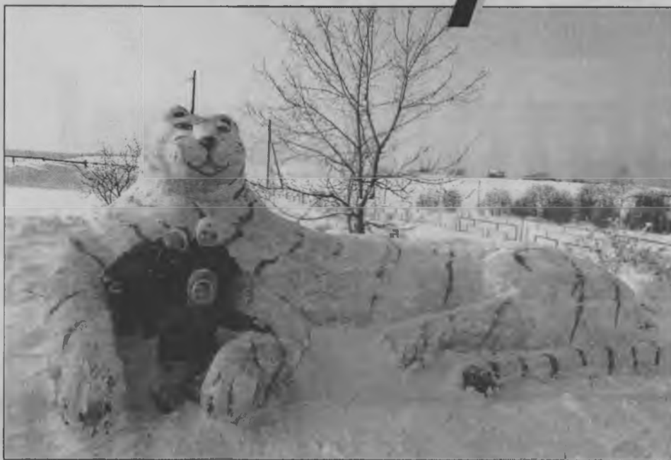
◆ В теплых объятиях снежного тигра.