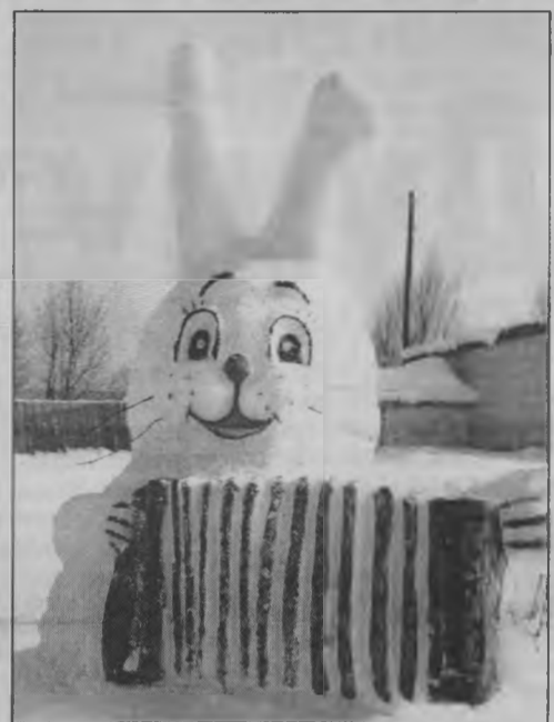
◆ «Я играю на гармошке...»