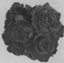
Дети, внуки, правнуки.

Наша милая, наша родная, Самый добрый ты наш человек! Мы желаем тебе, дорогая, Чтоб подольше продлился твой век! Пусть смеются вокруг тебя внуки, Дети помнят и любят всегда Твои нежные, добрые руки И в улыбке лучистой глаза. Не болей, не старей, дорогая, Рады мы, что ты есть на земле, Наша милая, наша родная, Счастья, радости в жизни тебе.