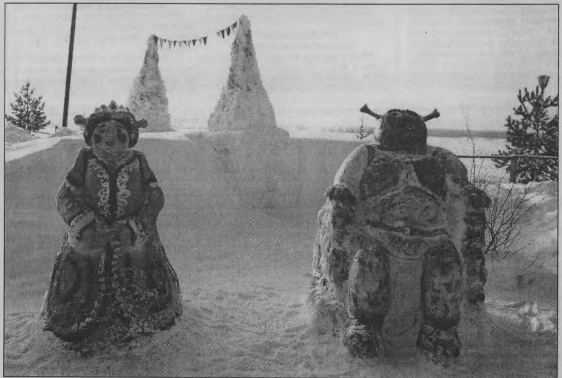
◆ Шрек и Фиона - сладкая парочка.