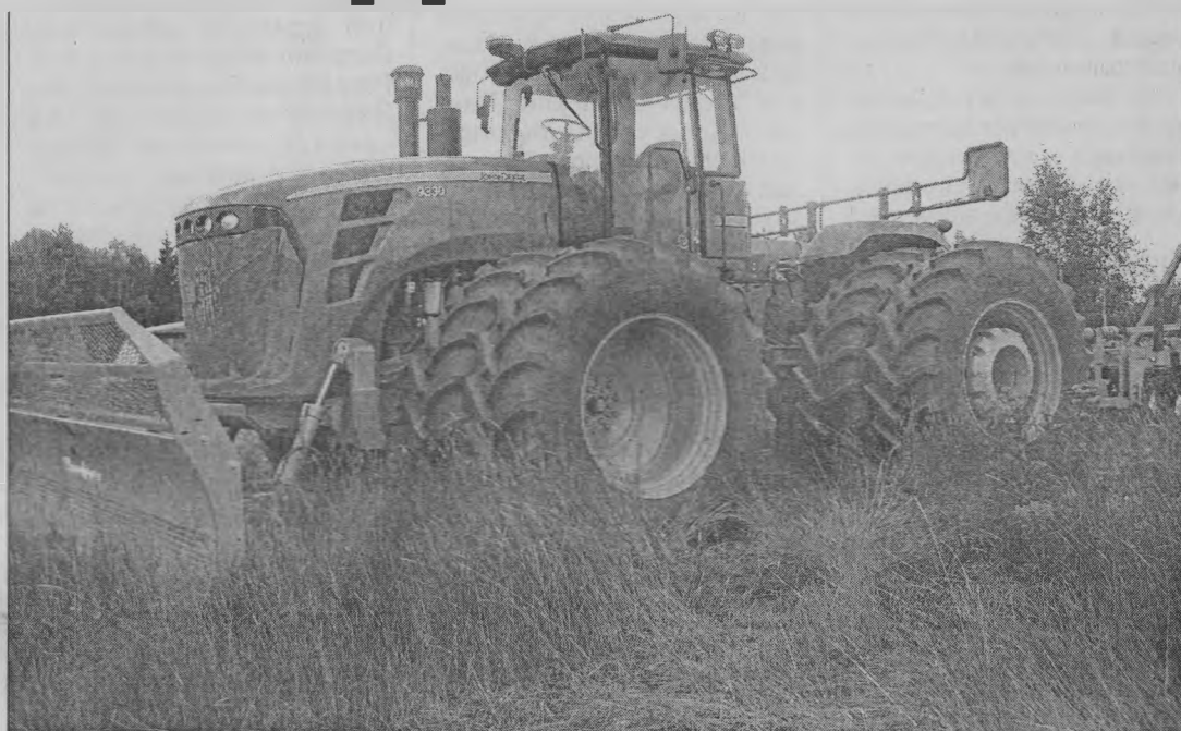
◆ «JOHN DEERE» во всей красе.

Что это за трактор? Это американский трактор «JOHN DEERE». Выпускается уже много лет. Совершенствуется. Очень надежный в эксплуатации. Здесь все сделано для удобства человека, чтобы он работал, а не заморачивался на какие-то проблемы. Удобная кабина с кондиционером и системой навигации. Задается программа, и трактор выполняет