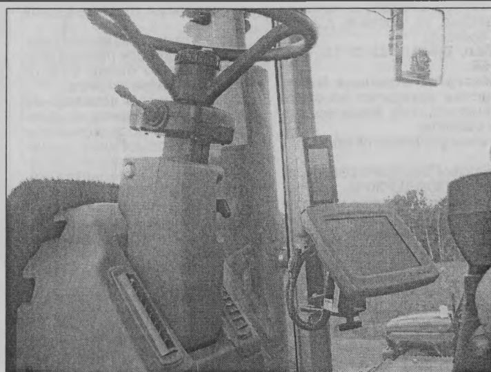
◆ В кабине трактора.

Да без всякого сомнения реально. Научиться можно всему,