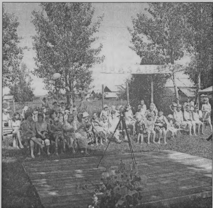
◆ На празднике Дня деревни Ошары.