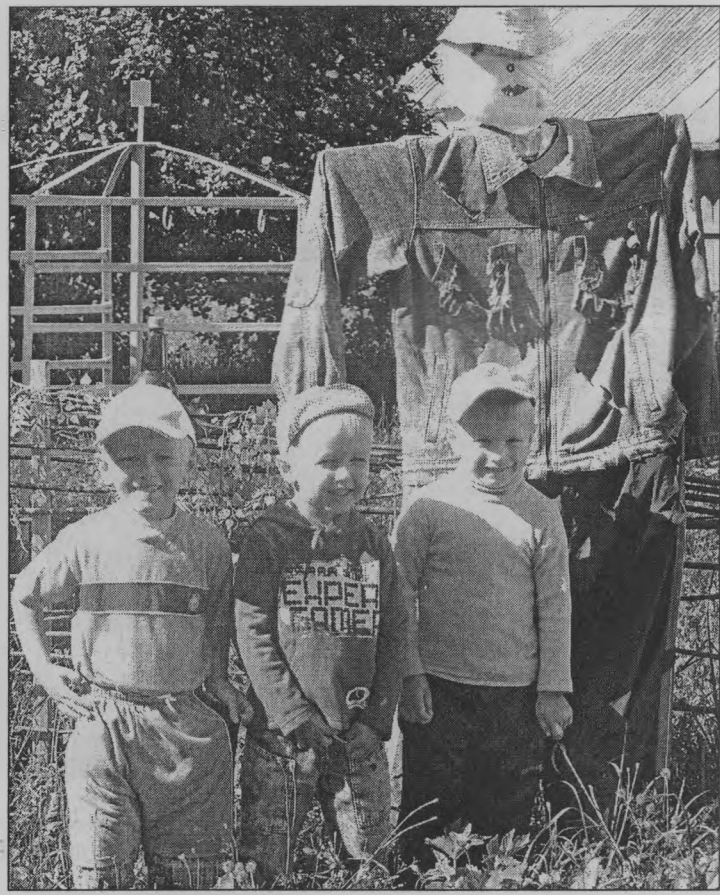
◆ Стараемся для детей.