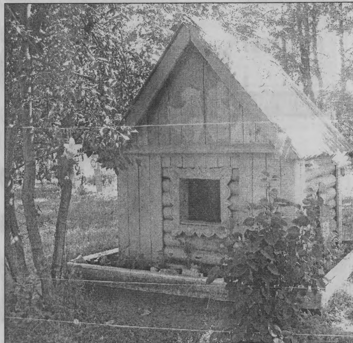
◆ Тот самый домик.

Но есть одна проблема, о которой мне хочется сегодня громко сказать. Есть люди, вернее, это дети - подростки, которым нечем заняться, девать свою энергию, вероятно, плохо воспитанные или просто вредные, но им точно наплевать на чужой труд, на нашу красоту: они приходят и ломают, растаскивают по поселку сломанные поделки из картона, дерева, бумаги, ткани, засыпают землей водоемы, крадут плавающие игрушки. Так было и зимой, когда ломали наши постройки, так и летом. Могут шаловливые дети накидать на нашей территории стекол, сломать цветы, поджечь домик. Знают ли родители, чем занимаются их дети в свободное время? Хотелось бы, чтобы таких неприятностей не было совсем. С таким трудом потом приходится успокаивать педагогов и каждый раз убеждать, что надо, снова надо делать что-то для ребят. Прошу всех: не проходите мимо таких событий - обращайтесь внимание на творящих безобразие, подрастающих наших же детей.