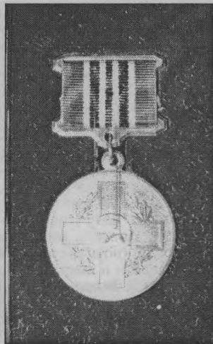
◆ Памятная медаль.