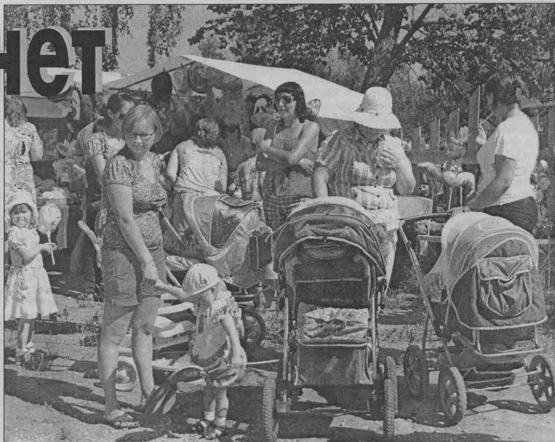
◆ Прекрасное будущее поселка - дети.