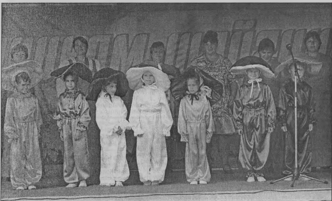
◆ С поздравлением - артисты.